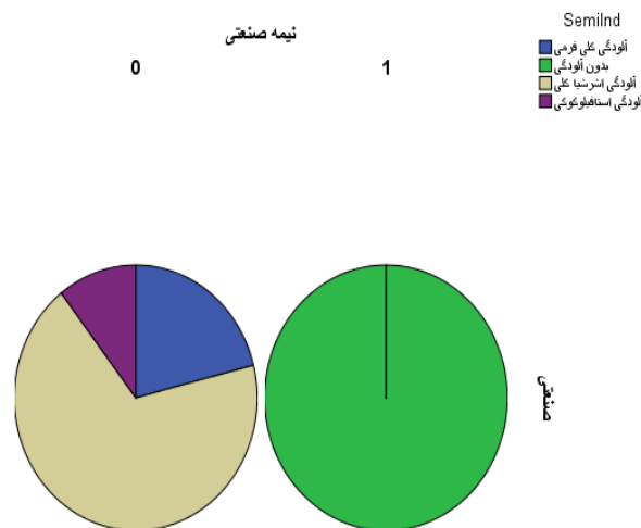
نمودار شماره ۱: آلودگی کل نمونه‌های صنعتی در مقایسه با آلودگی کل نمونه‌های نیمه صنعتی