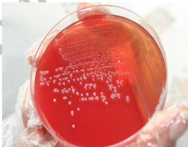
شکل ۱- محیط کشت آگار خون دار حاوی پرگنه‌های باکتری عامل بیماری استرپتوکوکوزیس