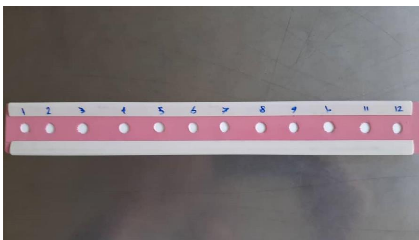
تصویر ۱ و ۲- کاست تهیه شده برای آزمون لکه گذاری نقطه ای