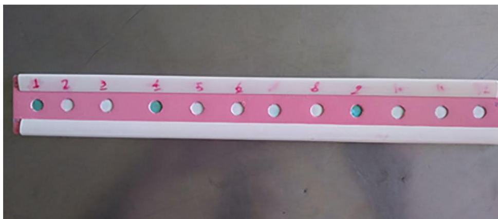
تصویر ۴- لکه گذاری نقطه ای کنترل مثبت و منفی و دو نمونه آلوده به بورخولدریا مالئی

در این بررسی از ۴۰ نمونه، شش مورد مثبت مشمشه در استان های اصفهان، بوشهر، فارس و گلستان شناسایی