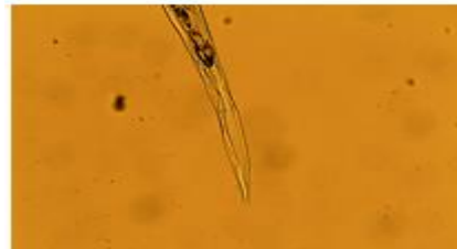
شکل ۱- تصاویر ناحیه دهانی و دمی نماد Syphacia obvelata (بزرگنمایی = ۱۰۰x)

بود. پس از رنگ آمیزی سستدهای جداشده با رنگ آلوم کارمین و با کلیدهای تشخیصی مشخص شد که تمامی سستدها Rodentolepis nana هستند (شکل ۲). (۴).