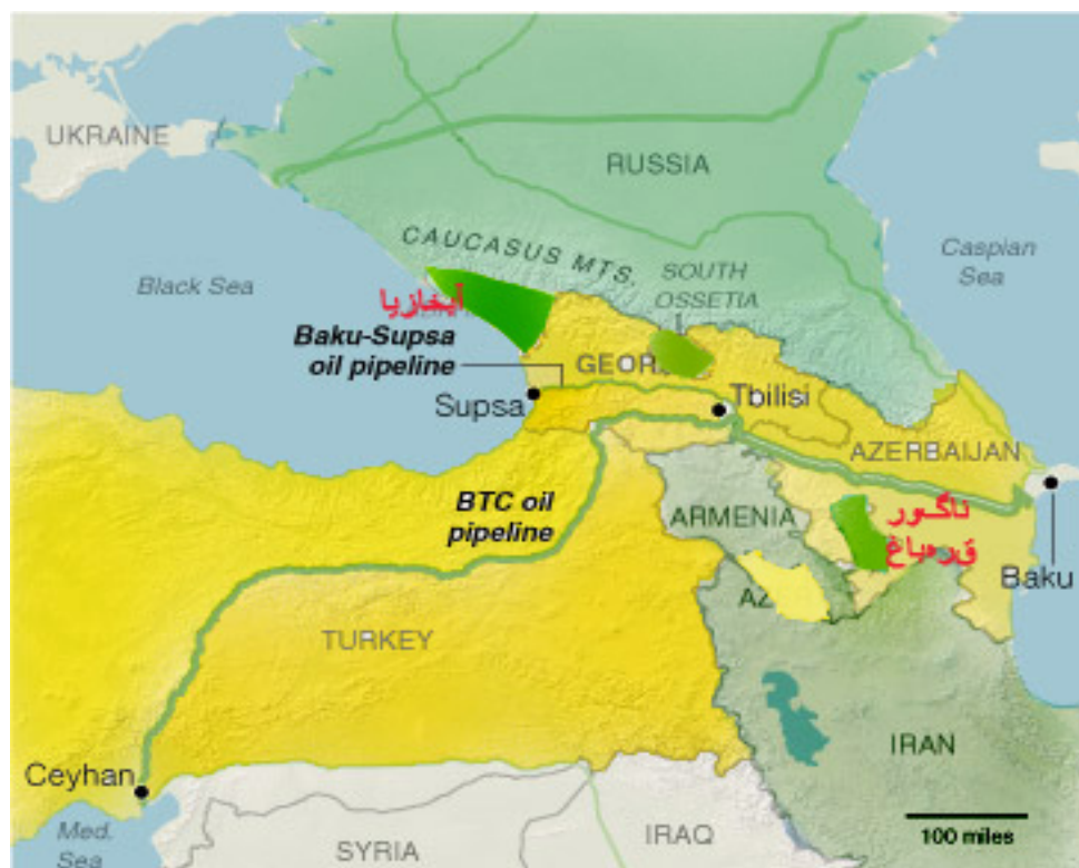
نقشه ۲- قدرت‌های رقیب منطقه‌ای