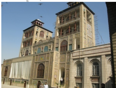
شکل شماره ۵: شمس‌العماره

میدان ارگ هسته اولیه شهر تهران است که در اعصار مختلف تاریخی فراز و نشیب‌های زیادی را سپری کرده است. علیرغم توسعه روزافزون شهر تهران در ۲۰۰ سال گذشته، هنوز این میدان نقش مرکزی و خاطره‌انگیزی خود را حفظ کرده و می‌تواند در کنار بازار بزرگ تهران یک محور تاریخی فرهنگی در قلب یکی از پر مخاطب‌ترین محورهای کلان شهر تهران باشد. در ادامه به ذکر مهمترین ویژگی‌های گردشگری این محور می‌پردازیم: - وجود چندین جاذبه ارزشمند درجه ۱ به لحاظ قدمت، نوع بنا و زیبایی اثر مانند: مجموعه کاخ گلستان، شمس‌العماره، تخت مرمر، ورودی بازار بزرگ و مسجد شاه.