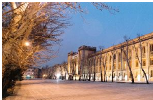
شکل شماره ۲: موزه پست

میدان مشق سابق یا باغ ملی فعلی همچون میدان توپخانه از میادین تاریخی تهران با تاریخچه‌ای مملو از مسائل سیاسی، اجتماعی، نظامی، فرهنگی و هنری در دوره قاجار و پهلوی است. این میدان که سربازخانه مرکزی در آن واقع بوده و نظامیان در آن مشق نظام می‌کردند، از شمال به خیابان سرهنگ سخایی و از جنوب نیز به خیابان امام خمینی (ره) محدود می‌شد و محوطه کنونی موزه پست و مخابرات، سر در باغ ملی، ساختمان شماره ۲ وزارت امور خارجه، موزه ۱۳ آبان، موزه ایران باستان، کتابخانه ملی، کاخ شهربانی، کاخ وزارت امور خارجه، عمارت ثبت اسناد املاک، ساختمان شماره ۷ وزارت امور خارجه، بنای وزارت جنگ سابق، ساختمان هنرستان دختران یا مدرسه کودکان بی‌سرپرست را در بر می‌گیرد.