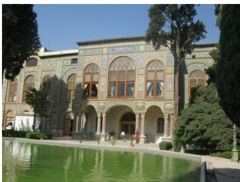
عکس شماره ۸: مجموعه کاخ گلستان