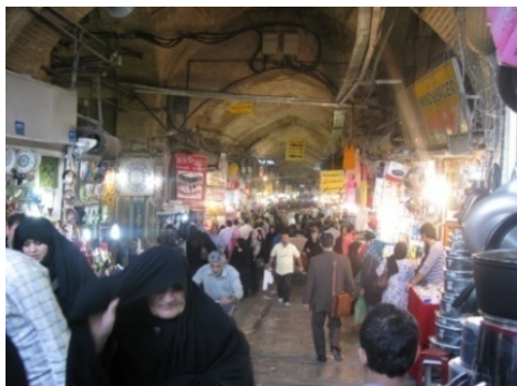
شکل شماره ۴: بازار بزرگ تهران

چند نام و تعداد محدودی ساختمان که در مجموعه کاخ گلستان قرار گرفته، ردی باقی نمانده است. همچنین بازار تهران یکی از قدیمی‌ترین بخش‌های تهران است. به طوری که قدیمی‌ترین اسناد کالبدی تهران همچون آثاری از آل‌بویه و سلجوقی در مسجد جامع و بقعه‌های اطراف آن - که در محل بازار قرار دارد - مشاهده شده است. همچنین بقعه‌ای از دوره تیموری در امامزاده زید(ع) وجود دارد.