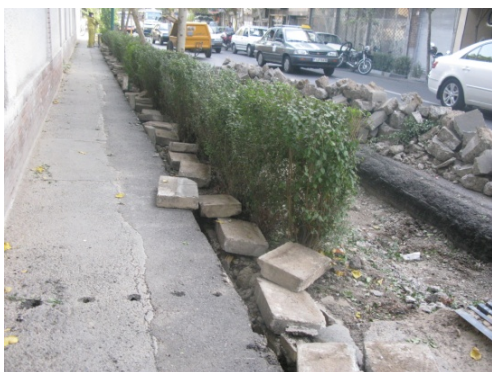
شکل شماره ۷: بازسازی مسیر پیاده در خیابان سی تیر

برای اینکه بتوانیم از این بافت تاریخی علاوه بر فعالیت های تجاری و اداری آن استفاده گردشگری هم داشته باشیم. باید از نماها و منظرهای مناسب حال گردشگران استفاده کنیم. سیما و منظر بازار بزرگ و فضاهای اطراف آن و مجموعه کاخ گلستان در میدان ارگ بالقوه دارای سیمایی تاریخی و مورد توجه گردشگران هستند. اما متأسفانه در سالهای گذشته عدم توجه به سیمای تاریخی شهر و تردد زیاد به منظور تجاری در این محور دچار سیمای آشفته‌ای شده است. تنها اتفاق خوب سالهای گذشته برای این محور ایجاد پیاده راه در محور ورودی بازار و درشکه سواری در این محور است.