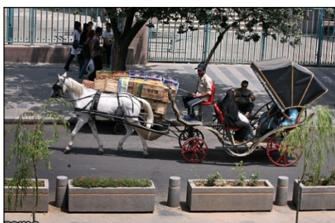
شکل شماره ۶: مسیر کالسکه رو - بازار تهران