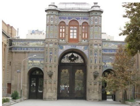
شکل شماره ۳: سر درب باغ ملی

- وجود چهار جاذبه گردشگری که به لحاظ قدمت، آثار منحصر بفرد، زیبایی و جذابیت اثر «درجه ۲» محسوب می‌شوند. همچنین برد این آثار در سطح ملی تعریف شده است. مانند: میدان مشق، باشگاه افسران، موزه پست و ارتباطات (اداره پست قدیم) و کاخ شهربانی.