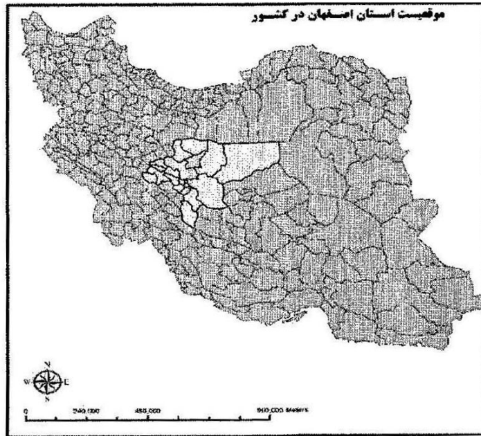
نقشه شماره (۱): موقعیت استان اصفهان در تقسیمات کشوری

ظروف سفالی، به طور کامل پخته شده و نقش و نگار و رنگ آمیزی آن هم تکامل یافته است. اشیاء ساخته شده از مس و برنز و استخوان جانورانی مانند: