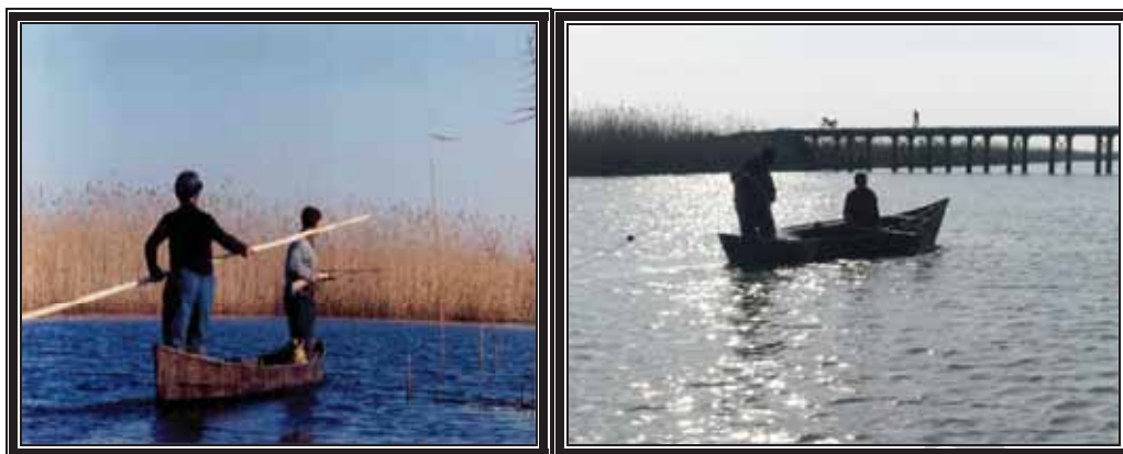
عکس شماره ۷ و ۸- شکار و صید انواع ماهی‌های تالابی برای معیشت ۴ فصل حاشیه‌نشینان تالاب انزلی