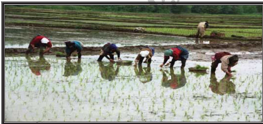
عکس شماره ۵- شالیزارهای روستاهای حاشیه تالاب انزلی

الف: اثرات مثبت: سالم‌سازی و سالم نگه‌داشتن این نگیں کم‌نظیر در حفظ و حراست، چشم‌انداز طبیعی آن - استفاده بهینه و به موقع از فرآورده‌های تالاب از قبیل صید ماهی - شکار پرندگان - برداشتن