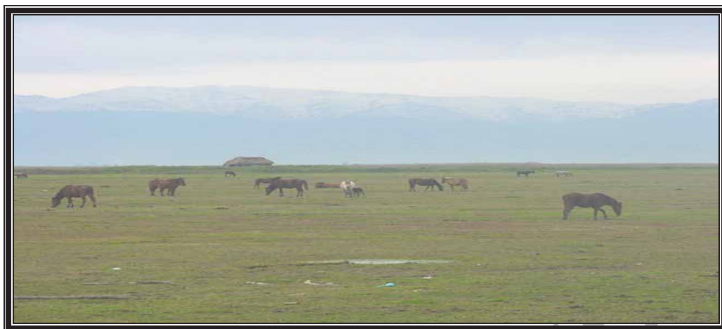
عکس شماره ۶- فرق محلی برای نگهداری انواع دام‌های بزرگ در حاشیه تالاب انزلی