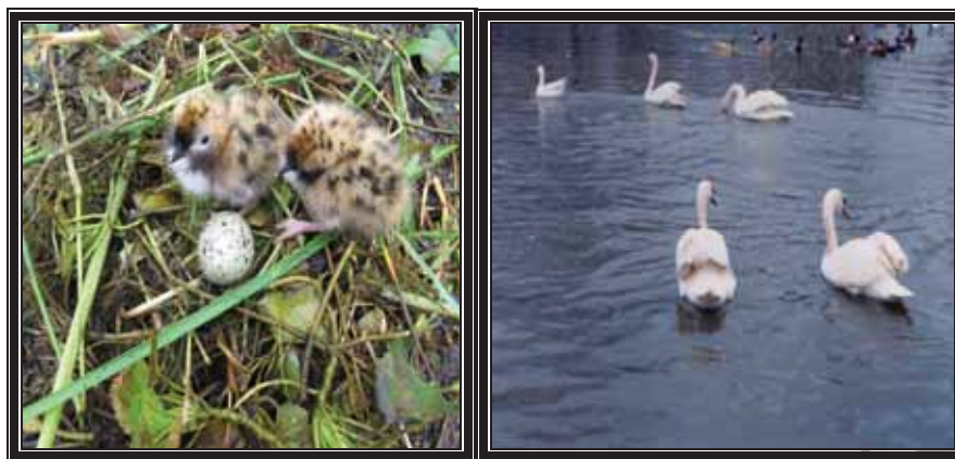
عکس شماره ۳ و ۴- جوجه‌گذاری پرندگان مهاجر در محدوده حفاظت‌شده تالاب انزلی و پرندگان مهاجر زمستان‌گذران در تالاب انزلی