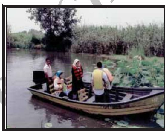
عکس شماره ۲۱ - لاله دریایی یکی از دیدنی‌های منحصر به فرد تالاب انزلی و قایقرانی تفریحی (گردشگری)