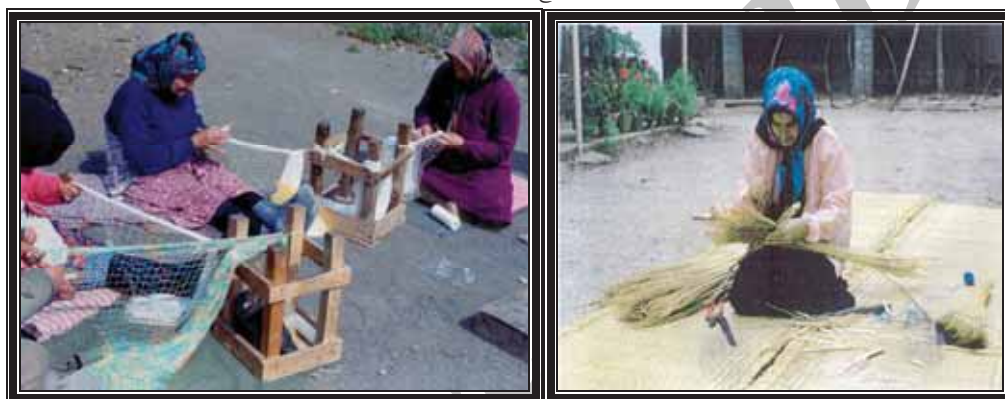
عکس شماره ۹ و ۱۰- نمونه‌ای از صنایع دستی وابسته به تالاب انزلی (زنان روستایی)