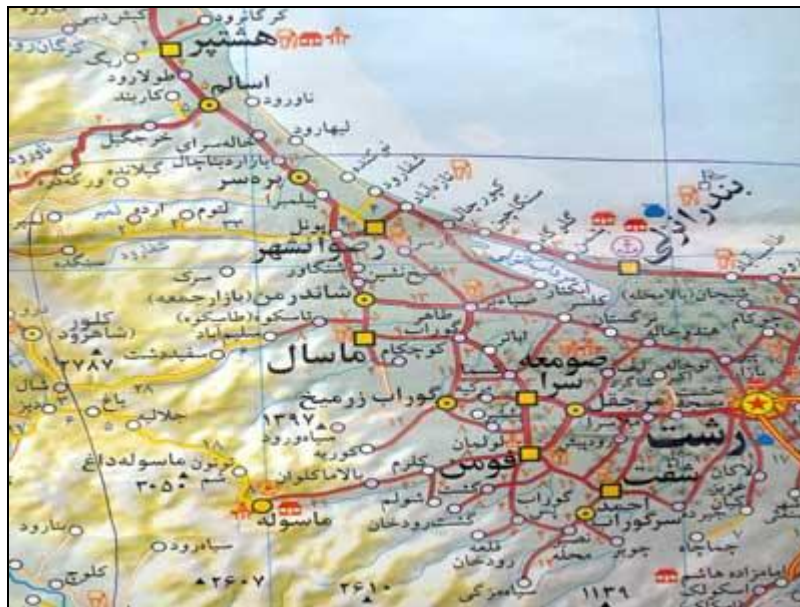
نقشه شماره ۴- طبیعت مازندران

از لحاظ طبیعی مازندران به سه قسمت اصلی کوهستانی در جنوب، میان بند در وسط و جلگه‌ای در شمال تقسیم می‌شود. شیب ناهمواری‌های آن از غرب به شرق به موازات دریای خزر است. رشته کوه البرز با رودهای کوچک و بزرگی که در امتداد شمالی - جنوبی آن جریان دارند به سه منطقه غربی، مرکزی و شرقی تقسیم شده است. بر اساس سرشماری سال ۱۳۹۰، جمعیت استان مازندران بالغ بر ۳۰۷۳۹۴۳ نفر است کل جمعیت نقاط شهری برابر ۱۶۸۲۱۵۲ و کل جمعیت نقاط روستایی برابر ۱۳۹۱۷۸۶ نفر است. اهالی مازندران به زبان‌های فارسی و گویش مازندرانی تکلم می‌کنند. گویش مازندرانی که بازمانده زبان ایرانیان قدیم (پارسی میانه) است تقریباً در همه جای استان متداول است. در این استان ۹۹/۷ درصد جمعیت آن را مسلمانان شیعه تشکیل می‌دهند.