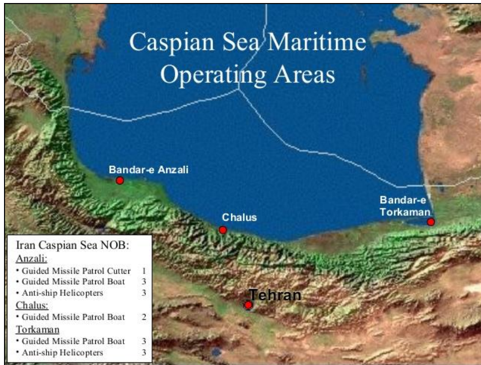
نقشه شماره ۲- مهم‌ترین بنادر فعال دریای خزر در سواحل ایران

سال‌های اخیر به دنبال استقلال جمهوری‌های حاشیه دریای خزر، موقعیت سیاسی و اقتصادی دریای خزر دگرگون گشت و در این میان ایران به‌عنوان نزدیک‌ترین راه ارتباطی این کشورها به دریای آزاد و قرار داشتن در مسیر کریدور شماره ۹ (شمال- جنوب) از اهمیت خاصی برخوردار گردید. حمل و نقل و جابجایی کالاها از طریق بنادر دریای خزر به اروپا در مقایسه با مسیر خلیج فارس به علت شرایط مساعد آب و هوایی، ارزانی نرخ حمل و نقل و کوتاه بودن مسیر کشتیرانی بسیار مناسب‌تر و مقرون به صرفه است.