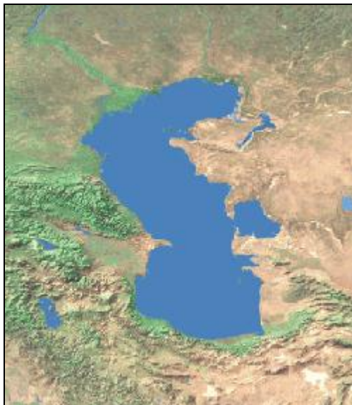
نقشه شماره ۱- موقعیت کلی دریای خزر

دریای خزر با وسعتی حدود ۴۳۸۰۰۰ کیلومترمربع بزرگ‌ترین دریاچه کره زمین به شمار می‌رود که از طریق رود «ولگا» و «ولگادن» به دریای سیاه و دریای بالتیک راه یافته و بنادر دریای خزر را به بنادر شمالی و جنوبی اروپا متصل می‌نماید. عمق این دریا از شمال به جنوب افزایش یافته بطوریکه عمق نواحی شمالی از ۱۶ متر تجاوز ننموده و در جنوب و جنوب غربی عمیق‌ترین نقطه آن به ۱۰۰۰ متر می‌رسد.