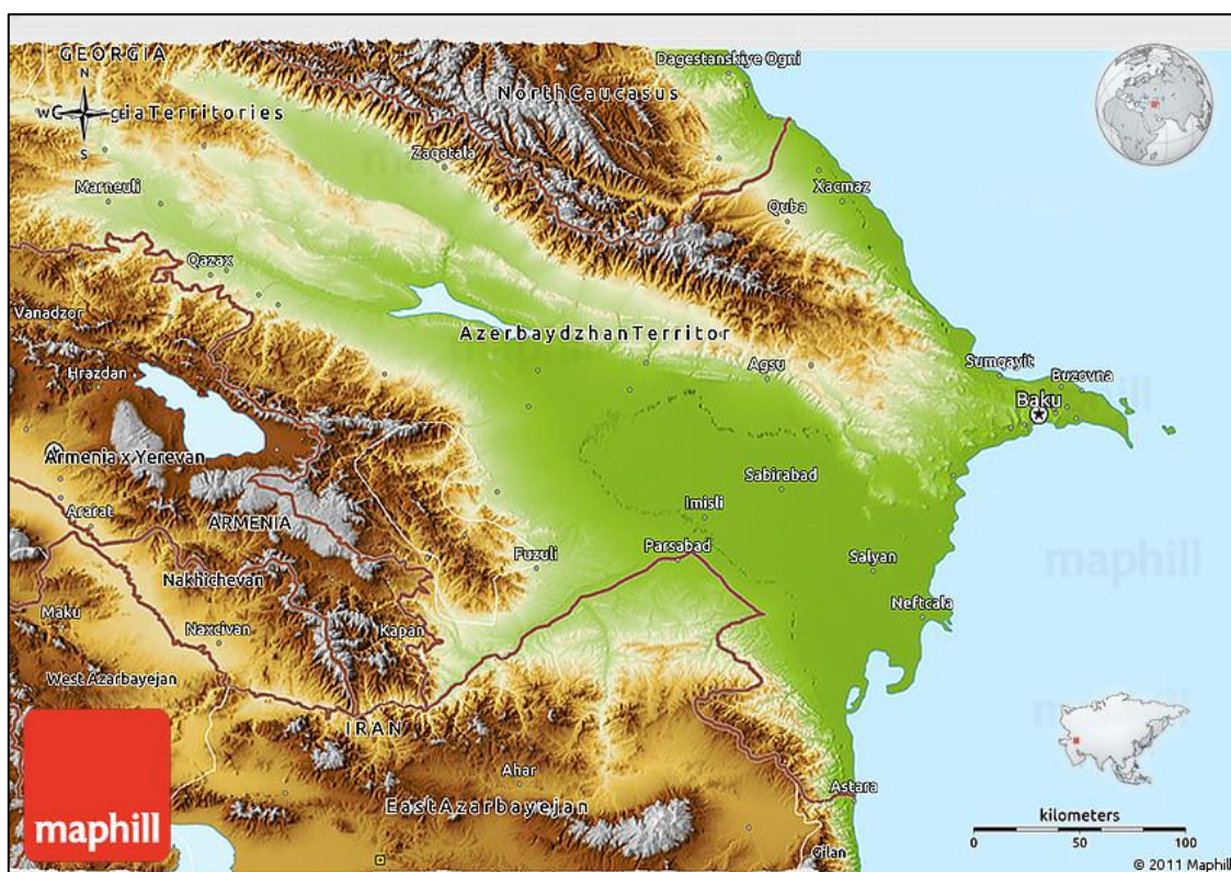
نقشه شماره ۵- موقعیت مرزی آستارا در مجاورت کشور آذربایجان

گیلان از نظر زمینی و دریایی هم‌مرز با کشور آذربایجان می‌باشد و با توجه به تحرکات قدرت‌های فرا منطقه‌ای در این کشور که می‌تواند منافع ملی جمهوری اسلامی ایران را با تهدید مواجه سازد؛ بنابراین تحلیل نقش آمایش سرزمین در توسعه و امنیت مرزی آستارا دارای اهمیت ویژه‌ای است. در این میان عواملی چون دوری از مرکز و انزوای جغرافیایی، تبادلات مرزی، تفاوت‌های فرهنگی و تهدیدات خارجی از عوامل مؤثر بر آمایش این منطقه شناخته شده‌اند (Ezzati & Hasani, 2014: 191).