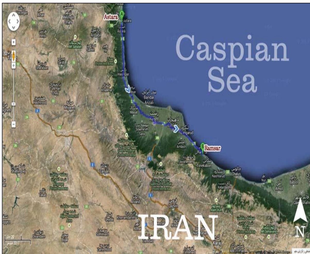
نقشه شماره ۲- نقشه جغرافیایی آستارا

عامل همگرایی دو کشور آذربایجان و ایران با داشتن زبان مشترک ۱- ورود خرده فرهنگ‌های ناشی از ورود مسافران به این منطقه ۲- تغییر کاربری زمین‌های کشاورزی به ویلایی و تفریحی ۳- شیب کم زمین ۴- کاهش شاغلان بخش کشاورزی به دلیل احداث بازارچه مرزی ۵- نبود تسهیلات لازم برای جذب نیروهای متخصص داخلی برای کارآفرینی، ایجاد اشتغال و توسعه اقتصادی برای منطقه ۶- وجود پدیده قاچاق و مبادلات غیرقانونی مرزی به دلیل نبود ضوابط و قوانین مناسب و بازدارنده (Zebaneh Et al., 2013: 43).