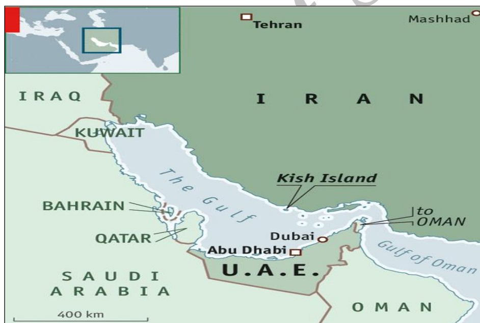
نقشه شماره ۱- موقعیت جزیره کیش

جزیره کیش که به مروارید خلیج فارس مشهور است با مساحتی حدود ۹۱ کیلومتر مربع در هیجده کیلومتری کرانه جنوبی سرزمین ایران قرار دارد. این جزیره از نظر تقسیمات سیاسی، جزئی از شهرستان بندر لنگه در استان هرمزگان محسوب می‌شود و از لحاظ وسعت بعد از جزیره قشم، مقام دوم را در خلیج فارس دارا است. در اواخر سال ۱۳۷۹ بر اساس نتایج سرشماری عمومی نفوس و مسکن، جمعیت جزیره کیش ۱۶۵۰۱ نفر برآورده شده است. نتایج سرشماری سال ۱۳۷۹ نشان می‌دهد ۱۳۵۹۳ نفر یا حدود ۹۳ درصد جمعیت کیش را افرادی تشکیل می‌دهند که طی ده سال اخیر به جزیره مهاجرت کرده‌اند (Hakimian, 2009: p.3-24).