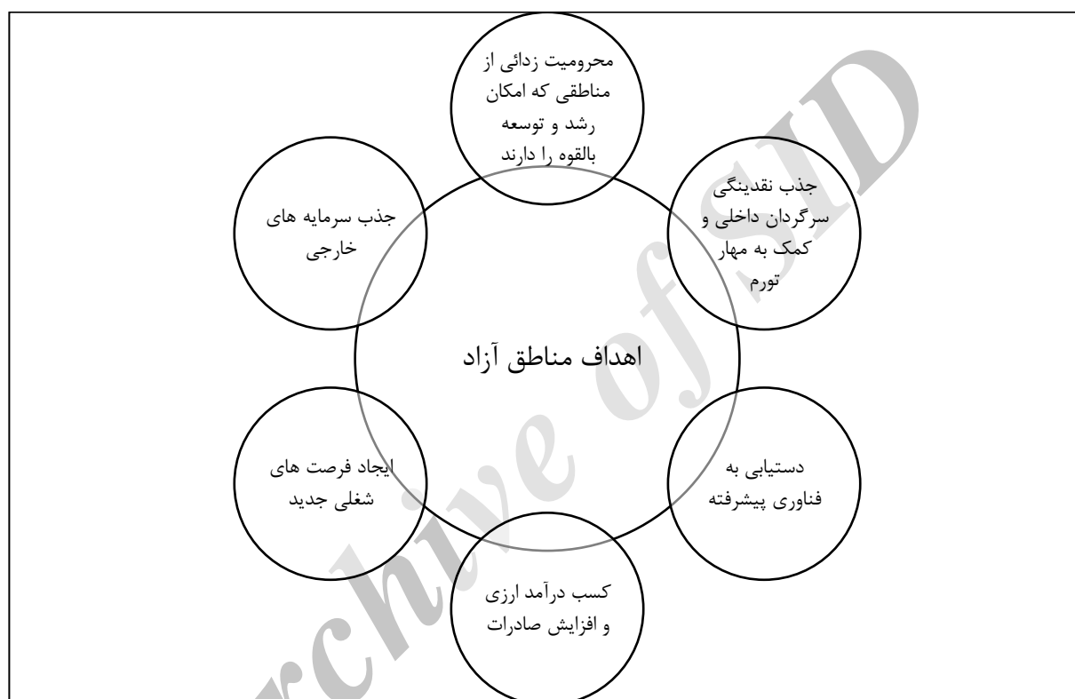
نمودار شماره ۱- اهداف مناطق آزاد