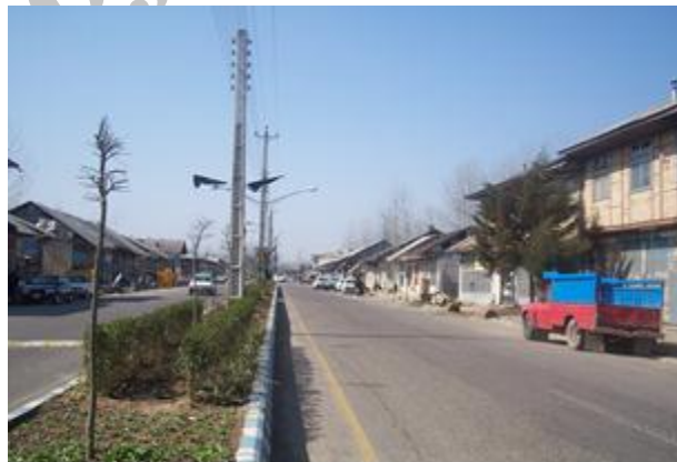
شکل شماره ۳: شکل‌گیری بافت تجاری و معابر عمومی شهر رودبند