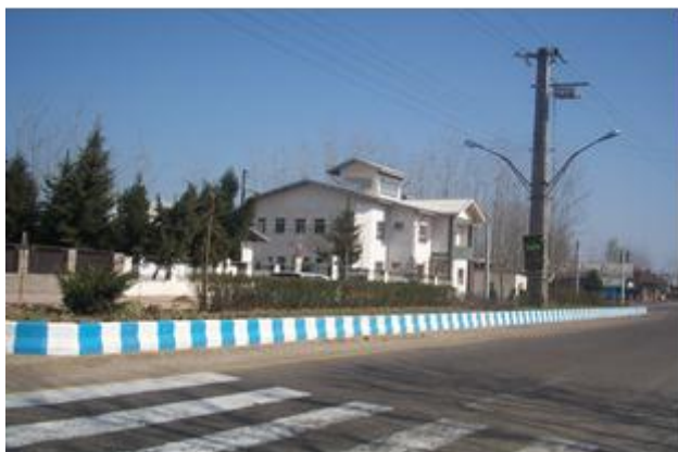
شکل شماره ۴: شکل‌گیری بافت اداری و معابر عمومی شهر رودبند

Source: Guide Plan of Roudbanch, 2003. Comprehensive and detailed plan of Roudbanch town, 2015.