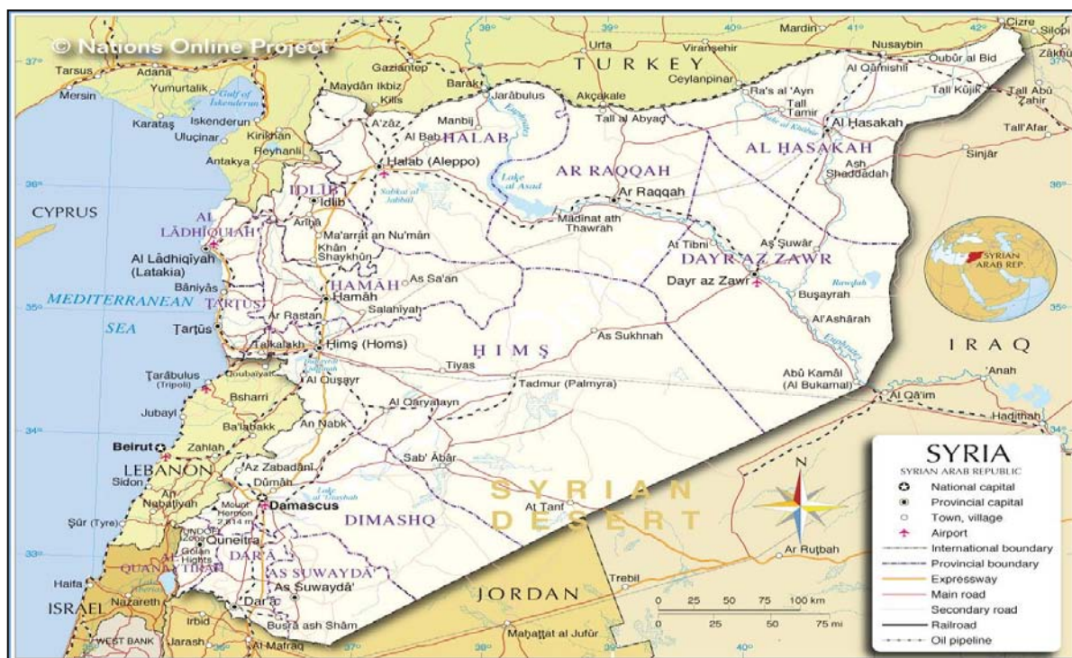
نقشه شماره ۲- کشور سوریه

برقراری توازن بین محورها و تضعیف مقاومت اسلامی و مهار ایران را دنبال نمی‌کند (Humud and et al.1998:p15-). (32)