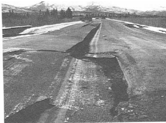
عکس شماره ۱: تخریب مسیر به علت تأثیر زلزله

مردم اطلاعات زیادی از چیزهایی که هست، دارند. به همین خاطر کنترل کردن آنها آسان است. ولی در یک شهرگسترده استفاده از این روش ممکن نیست (Miriam & Shulman, 2008:20).