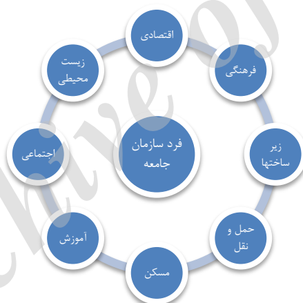
نمودار شماره ۱ چرخه تاب‌آوری

مفهوم تاب‌آوری اولین بار در سال ۱۹۷۳ توسط هولینگ در مقاله‌ای تحت عنوان "تاب‌آوری و پایداری سیستم‌های اکولوژیکی" با دیدگاه محیط زیستی مطرح شد. در پژوهش‌های هولینگ با پیدایش یک شاخص گمشده در مفهوم تاب‌آوری به نام "طرفیت تغییر"، مواجهیم که اساس تاب‌آوری است (Cross, 2008). طبق تعریف هولینگ، تاب‌آوری عبارت است از: معیاری از توانایی سیستم برای جذب تغییرات، در حالی که هنوز مقاومت قبلی را دارد (Holling, 1973). در نگاه سطحی، هدف از "تاب‌آوری" بعنوان آرمانی جهانی در سطح فردی، سازمانی و جامعه‌ای مطرح است. ولی در واقع تاب‌آوری در برابر بلایا، نیازمند ترکیب موارد متعددی است که در ظاهر مخالف هم هستند (Gadz Chac, 2011). همانطور که پیش‌تر ذکر شد، شهر مجموعه‌ای از شبکه‌های متنوع ذینفعان در قالب ساختار پیچیده است. ایجاد قالبی برای فرصت تاب‌آوری به نحوی که همه دست اندرکاران بتوانند آنرا با مأموریت و اهداف فعلی خود تنظیم کنند می‌تواند دشوار باشد. در این میان سانفرانسیسکو (کالیفرنیا) از "چرخه تاب‌آوری" با زمینه‌های کاربردی هشتگانه آن استفاده می‌کنند تا به شرکا چه در داخل و چه خارج از دولت نشان دهد مأموریت سازمان آنها به چه نحو با آن دسته از ذینفعان که در بخشهای متفرقه دیگر کار می‌کنند و ممکن است تصور شود کار آنها کاملاً متفاوت است، ارتباط پیدا می‌کند.