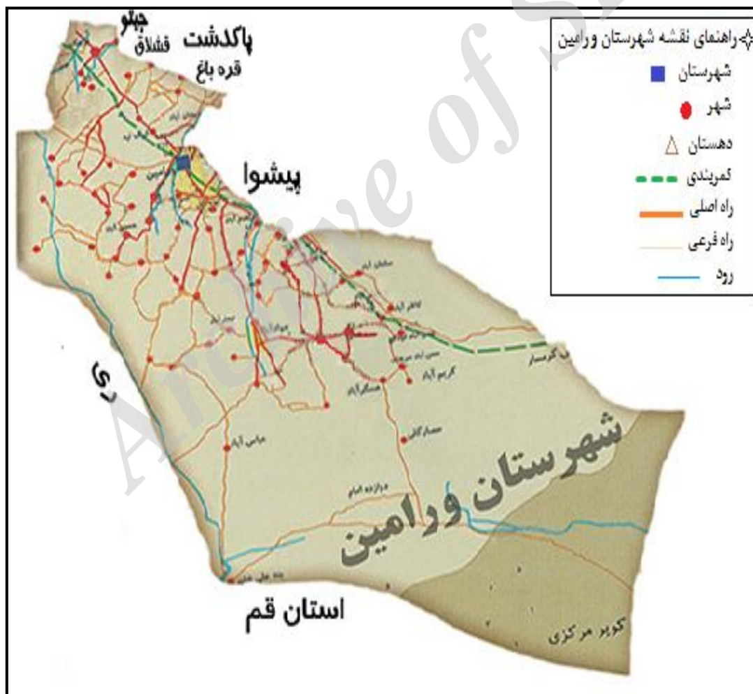
نقشه‌ی شماری (۱): نقشه شهرستان ورامین

شهر ورامین به دلیل نزدیکی به تهران، داشتن اقتصاد کشاورزی، انتقال صنایع از شهر تهران به این منطقه، بالا بودن هزینه‌های زندگی، تورم در شهر تهران، نیاز تازه واردین به اشتغال و مسکن و ... طی دهه‌های اخیر پذیرای خیل عظیمی از مهاجران می‌باشد. شرایط اقتصادی ورامین حول محور، خدمات صنعتی و کشاورزی، شکل گرفته است. در گذشته نقش شهر بیشتر کشاورزی بوده، اما امروزه، کشاورزی در رده‌ی پایین قرار گرفته (خدمات ۴۵٪، صنعت ۴۰٪، کشاورزی ۱۵٪) که براساس آمار سال ۱۳۸۰ برآورده شده است. از طرفی، بیشترین محصولات کشاورزی آن گندم، صیفی جات، جو و علوفه برای دامداری و ... می‌باشد. همچنین، معادن زیاد از جمله: سنگ استرانسیوم، سولفات دوسود (شوره)، باریت و گچ که این مواد معدنی و نیز فراورده‌های کشاورزی و دام زنده، همگی حائز اهمیت‌اند. اهالی بخش جواد آباد نیز به امر کشاورزی، دامداری، صنعت و صنایع دستی از قبیل: گلیم بافی، قالی بافی، قالیچه بافی اشتغال دارند و از جهت تولید گوشت سفید و قرمز و غلات و ... در وضعیت مطلوبی قرار دارند.