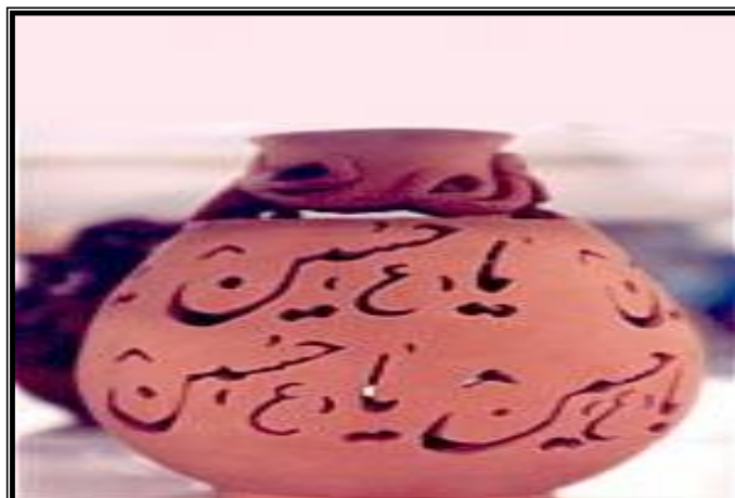
تصویر شماره‌ی (۲): سفالگری در ایران