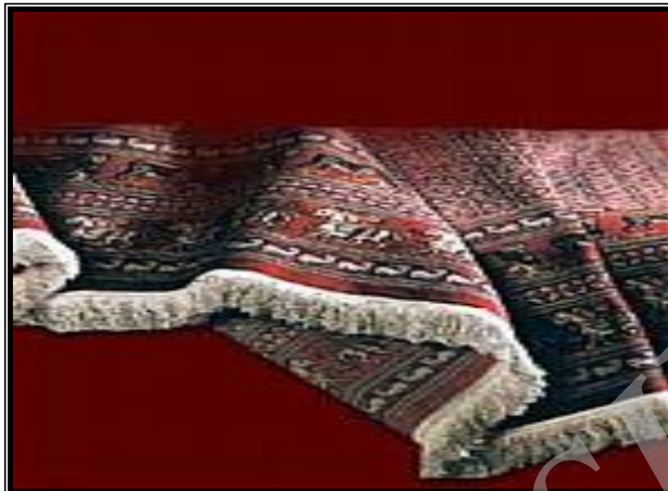
تصویر شماره ۱ (۱): گلیم بافی از صنایع دستی جوادآباد

از طرفی، صنایع دستی از نظر مواد اولیه یا شیوه ساخت گوناگون می‌باشند. طبقه بندی انجام شده توسط کارشناسان سازمان صنایع دستی ایران که به طور عمده بر مبنای روش و تکنیک ساخت این گونه محصولات به عمل آمده است، عبارتند از: