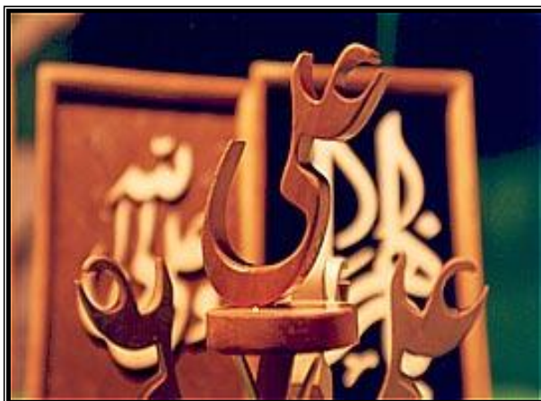
تصویر شماره ۴: صنایع دستی خراپی در کشور