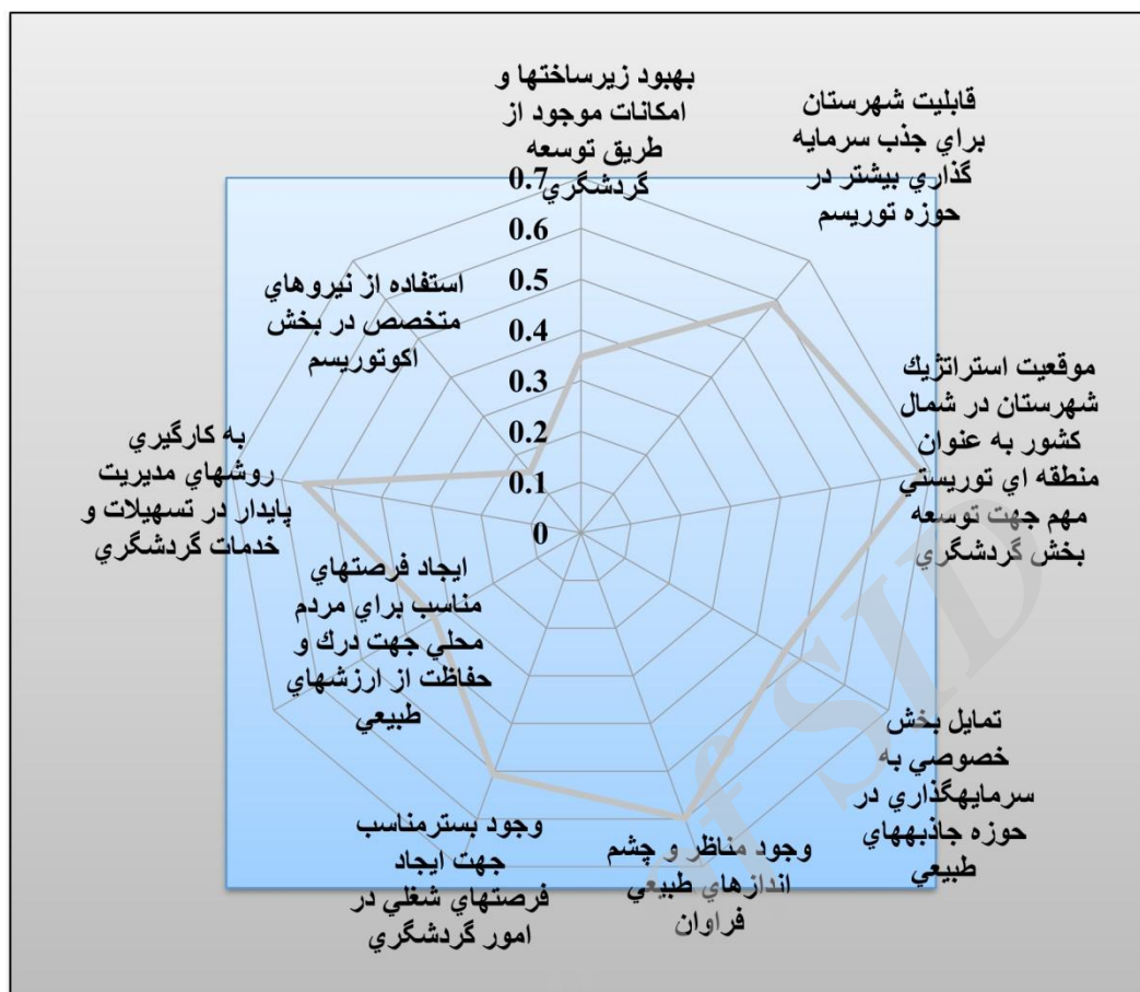
نمودار شماره (۱): رتبه‌بندی معیارها بر اساس مدل تاپسیس