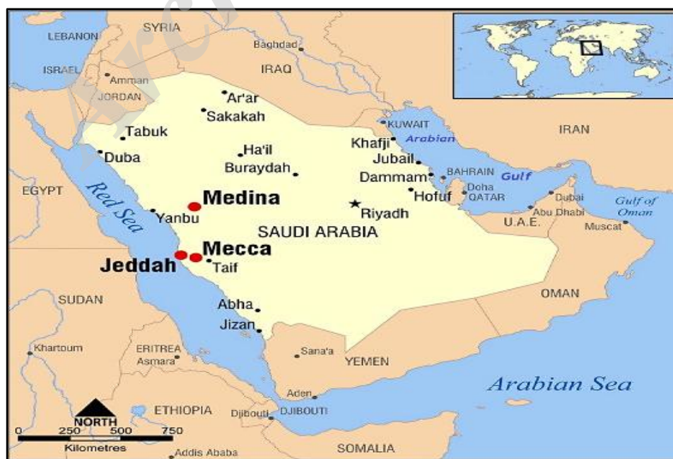
نقشه شماره ۱- موقعیت جغرافیایی عربستان سعودی (Smartraveller)

کویرها و صحاری وسعت قابل ملاحظه‌ای را به خود اختصاص داده است. مهم‌ترین کویرهای این بخش عبارت‌اند از: صحرای الدهننا، صحرای نفوذ و صحرای ربع الخالی، این صحرا، بزرگ‌ترین صحرای عربستان است و وسعتی را معادل پانصد و شصت هزار کیلومتر مربع اشغال کرده است. به لحاظ آب و هوایی، منطقه عربستان بسیار خشک و سوزان بوده و عموماً با وزش بادهای خشک، تل‌هایی از شن به این سو و آن سو در حرکت است. بارش باران نیز کم بوده و نواحی ساحلی گرم و مرطوب می‌باشد. آب و هوای این کشور، در تابستان بسیار گرم و در زمستان معتدل است. بارندگی به مقدار کم صورت می‌گیرد، به جز در مناطق شرقی که سالیانه ۴۰۰ کیلومتر بارش دارد.