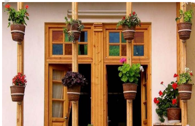
تصویر شماره ۳: نمایی از یک خانه در ماسوله

امروزه واحدهای ساختمانی تشکیل دهنده بافت تاریخی شهر ماسوله، مشتمل بر بیش از ۳۵۰ خانه مسکونی می‌باشند که شاخص‌ترین ویژگی آن‌ها هم جواری آنهاست. این هم جواری به گونه‌ای در نظر گرفته شده که باعث می‌شود تمام خانه‌ها زنجیروار و به هم پیوسته در امتداد خطوط توپوگرافی زمین قرار داشته باشند. هر واحد مسکونی نیز بین یک تا چهار طبقه دارد که بیش از ۷۰٪ آن‌ها به صورت دو طبقه احداث شده‌اند. به طور معمول پائین‌ترین طبقه غیر مسکونی بوده و کاربرد آن‌ها انبار و طویله است. راهروی ورودی خانه نیز در این طبقه واقع است. طبقات فوقانی نیز شامل فضاهای مسکونی بوده‌اند. طبقه پائین از مصالح سنگی و طبقات فوقانی از خشت بنا ساخته شده‌اند. این معماری به گونه‌ای سازگار با شرایط اقلیمی، توپوگرافیکی و اجتماعی، فضاهای داخلی تقریباً یکسانی را شامل می‌شده‌اند.