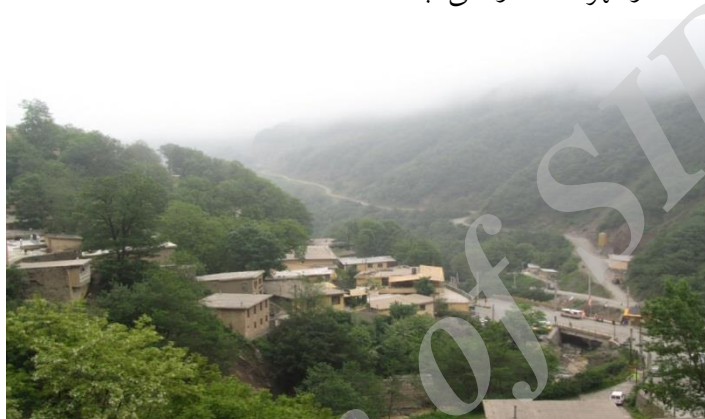
تصویر شماره ۱: نمایی از شهر ماسوله

ماسوله‌ی قدیم یا «کهنه ماسوله» که در فاصله «هشت کیلومتری غرب جاده ماسوله به خلخال» قرار گرفته است سکونتگاه اصلی و اولیه مردم ماسوله بوده است که اکنون آنچه در این مکان به چشم می‌خورد سنگ دیوار بناهای آن است. در نخستین کاوش‌های باستان‌شناسی شهرستان فومن که در شهریور ماه ۱۳۷۴ توسط هیئت پژوهشکده باستان‌شناسی سازمان میراث فرهنگی استان گیلان در این محوطه صورت گرفت مشخص شد که از سده پنجم تا هشتم هجری «کهنه ماسوله» به عنوان یکی از مراکز مهم در زمینه فلزکاری بوده است. همچنین سفال‌های لعابدار با رنگ‌های متنوع که مشخصات دوره سلجوقی را داشته‌اند در این منطقه کشف و این ناحیه به دلیل اهمیت و اعتبار تاریخی آن در شهریور ۱۳۸۵ در فهرست آثار ملی ثبت شد.