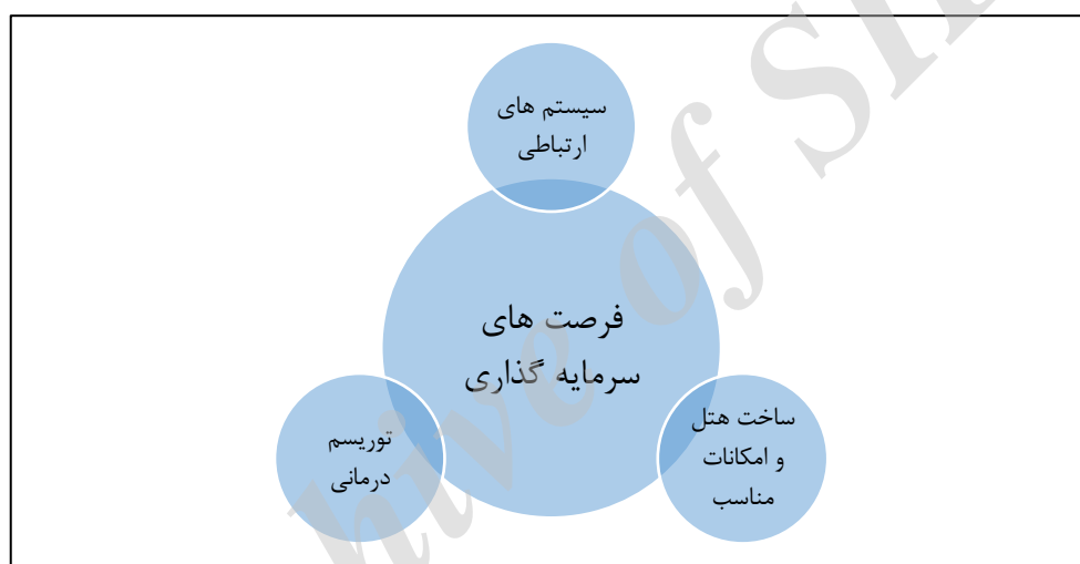
نمودار شماره ۱- بسترهای سرمایه‌گذاری در توریسم

محاسبات انجام شده نشان داده‌اند که ضریب فزاینده تولید در صنعت جهانگردی ایران معادل ۱/۶ است که این رقم بدان معنا است که اگر یک واحد پولی توسط جهانگردان در ایران هزینه و وارد چرخه اقتصادی کشور شود، باعث ایجاد تولیدی به میزان ۱/۶ واحد پولی در بخش‌های مختلف اقتصادی که به صورت مستقیم یا غیرمستقیم با آن در ارتباط هستند، خواهد شد. مقایسه این اثر با ضریب فزاینده سایر بخش‌های اقتصادی نشان می‌دهد که صنعت گردشگری ایران پس از صنایع غذایی (با ضریب ۲/۱۶) و ساختمان (با ضریب ۱/۷۲) در رتبه سوم در بین تمام بخش‌های اقتصاد ایران قرار دارد که نشان از قابلیت بالای صنعت یاد شده برای ایجاد رونق اقتصادی در کشور است. همچنین محاسبات انجام شده در مورد ضریب فزاینده اشتغال در بین بخش‌های مختلف اقتصادی نشان می‌دهد قدرت اشتغال‌زایی صنعت گردشگری در ایران بعد از بخش‌های کشاورزی، صنایع غذایی و ساختمان در رتبه چهارم قرار دارد (Ibid., 1386: 82).