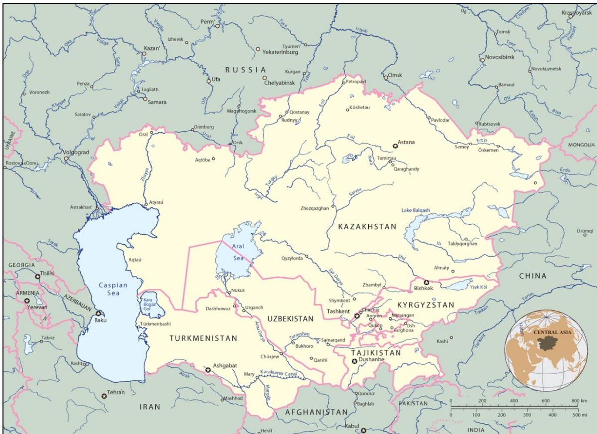
نقشه ۱: موقعیت جغرافیایی آسیای میانه

آسیای مرکزی یا آسیای میانه سرزمین پهناوری در قاره آسیا است که هیچ مرزی با آب‌های آزاد جهان ندارد. اگر چه مرزهای دقیقی برای این سرزمین تعریف نشده است، اما معمولاً آن را دربرگیرنده کشورهای امروزی، ازبکستان، تاجیکستان، ترکمنستان، قزاقستان، قرقیزستان می‌دانند.