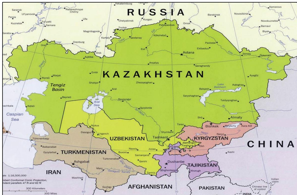
نقشه شماره ۲: کشورهای منطقه آسیای میانه