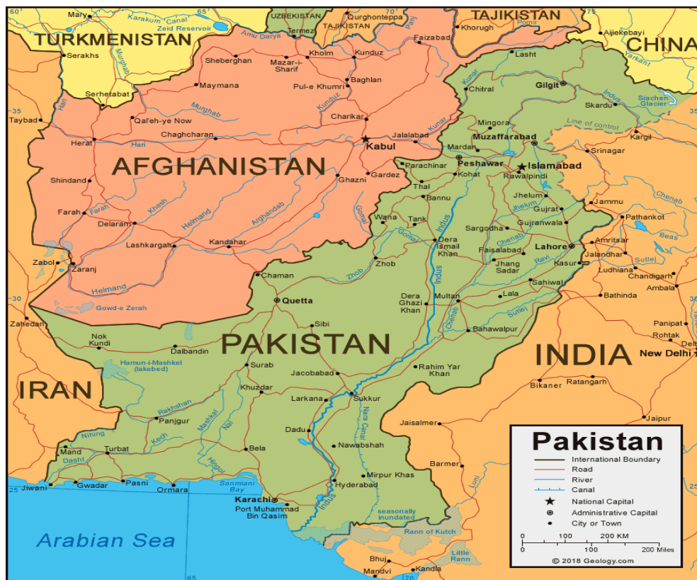
نقشه شماره ۱: موقعیت کشور پاکستان

(۵۶۵ مایل) از طرف جنوب غرب با ایران مرز دارد. پاکستان بر اساس آمار تخمینی (۲۰۱۷)، جمعیتی حدود ۲۰۰۰۰۰۰۰ تن دارد. پاکستان ششمین جمعیت بزرگ جهان را داراست که بیشتر از روسیه و کمتر از برزیل است.