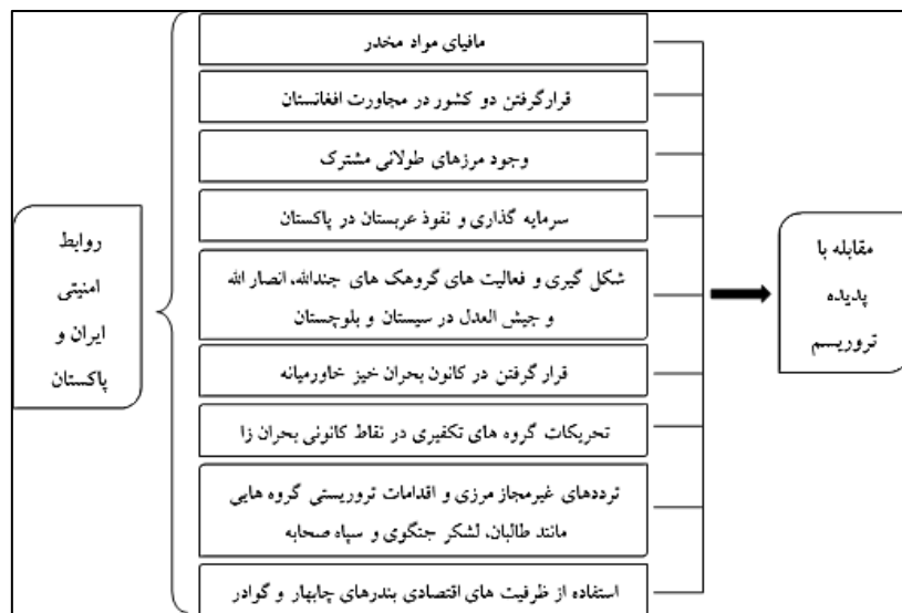
شکل ۲: الگوی روابط امنیتی ایران و پاکستان در مقابله با پدیده تروریسم از سال ۲۰۰۱ تا ۲۰۱۷