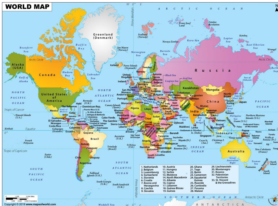
نقشه ۲: جغرافیای سیاسی جهان در قرن بیست و یکم

المللی آن سرزمین را بر عهده داشته است. مفهوم «کشور جدید و مستقل» شامل وضعیت های استعماری سابق و دیگر سرزمین‌هایی چون سرزمین‌های غیرمستقل، سرزمین های تحت مدیریت و سلطه سابق می‌شود که یا مسئولیت روابط خارجی را دارا بودند و یا چنین شناختی نداشتند. بنابراین شمار زیادی از این «کشورهای جدید و مستقل» با توجه به تعاریف بالا بر خلاف وفق و تصمیم دولت و کشور پیشین خود به جدایی و استقلال می‌رسند و حق تعیین سرنوشت را دارند. ۱ اما همانطور که گفته شده شاید در اول تصور شود که این حالت نوعی جدایی می‌باشد. براساس اعلامیه روابط دوستانه مجمع عمومی سازمان ملل متحد، این سرزمین‌ها دارای وضعیت حقوقی جدیدی مستقل از سرزمین اداره کننده خود هستند.