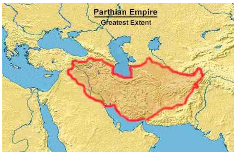
(18 Jun 2019). Map of Parthia at its Greatest Extent