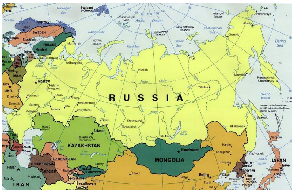
Map number 1: The geographic location of Russia (Allison and Simes, 2017)

روسیه یک کشور وسیع با ۱۷ میلیون کیلومتر مربع است که بجز دو منطقه محدود در شرق و غرب خود، مابقی سرزمین و مرزهایش توسط خشکی و آب‌های یخ زده سرد قطبی محاصره شده است. یکی از دغدغه‌های روسیه که در سال ۲۰۱۴ نیز منجر به تسخیر شبه جزیره کریمه توسط روسیه، جدا کردن آن از خاک اوکراین و ضمیمه کردن آن به خاک خود شد، همین بحث دسترسی به آب‌های گرم و آزاد بود. از همان ابتدا که پترکیبر خود را در رقابت با اروپاییان دید، مشخص شد روسیه دچار مشکل فضای حیاتی است. کشوری که از نظر جغرافیایی جای تنگی داشته باشد یا دسترسی به آب‌های گرم نداشته باشد دچار مشکل فضای حیاتی است. قبل از تحولات اخیر اوکراین، روس‌ها و اوکراینی‌ها توافقی با یکدیگر داشتند که بر مبنای آن ناوگان اصلی نیروی دریایی روسیه در بندر سواستپل باشد. ناوگان اصلی نیروی دریایی روسیه بعد از حرکت از بندر سواستپل باید از تنگه‌های داردانل و بسفر در دریای مرمره که در اختیار ترکیه است عبور کند و به دریای مدیترانه وارد شود. بعد از وارد شدن به دریای مدیترانه یا باید به سمت کانال سوئز حرکت کنند و یا کل طول مدیترانه را طی کنند تا به اقیانوس آرام برسند.