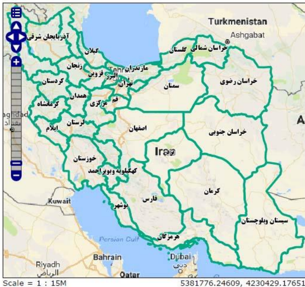
نقشه شماره ۱: نقشه ایران (http://tsm.ncc.org.ir)

شده است که با جداسازی فضاها و اختصاص فضاهای مخصوص بانوان به نوعی امکان بهره گیری آنها از برخی فضاها تسهیل و افزایش یابد.