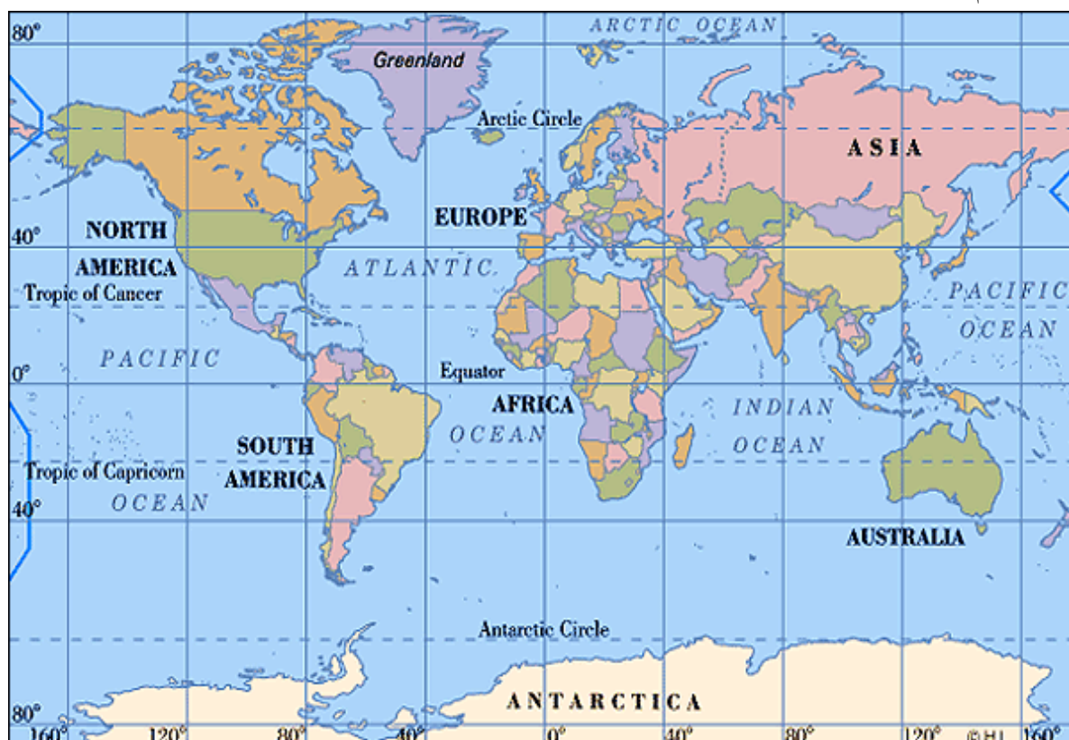
نقشه ۱: نقشه مناطق نظام بین‌الملل

سوئد در رتبه یک تا ده قرار دارند. کشورهای ژاپن، کره جنوبی، هنگ کنگ، ایسلند، دانمارک، بلژیک، اسرائیل، فرانسه، اتریش، ایتالیا و انگلستان در رده‌های بعدی قرار دارند. کشورهایی مانند فنلاند و سنگاپور، اسلونی و امارت هم موقعیت بسیار خوبی دارند. باید یادآوری نمود که موقعیت این کشورها بسیار به هم نزدیک است و اختلاف چندانی باهم ندارند.