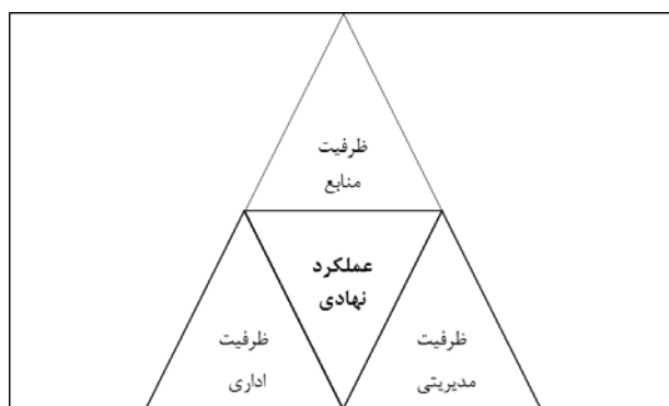
شکل ۱: ابعاد ظرفیت برای عملکرد نهادی

و بافت‌های تاریخی و قدیمی شهر با معماری سنتی و چشم‌نوازشان یکی از عناصر گردشگری شهری محسوب می‌شوند. نهادهای محلی به خصوص نهادهایی که در زمینه گردشگری و محیط‌زیست فعال هستند می‌توانند سرمایه‌گذاران را به سوی سرمایه‌گذاری در محورهای تاریخی شهر سوق دهند. بافت‌های تاریخی کانون و هسته شهرها هستند. حیات این بافت‌ها طی سده‌های گذشته پایه بسیاری از آداب و رسوم و حتی فرهنگ موجود و نیز رونق اقتصادی شهر و منطقه بوده است. فضاهای تاریخی شهری قبل از همه وظیفه دارند تاریخ، هویت عینی و ذهنی شهر را حفظ کنند و در زندگی جاری سازند. پاسدار همه خاطره‌ها و یادمان‌ها بوده و از این رو باید فعالیت‌هایی را در کالبد خود جای دهند که با هدف یاد شده انطباق یابد. چنین فضاهایی با توسعه فعالیت‌ها و فضاهای گردشگری در حفظ بناها و عناصر تاریخی خود موفق می‌شوند و حضور شب و روز شهروندان و گردشگران را امکان‌پذیر می‌سازند. نهادهای محلی می‌توانند از این ظرفیت خود استفاده نمایند و با جلب و حضور مشارکتی مردم، جوانان و نوجوانان در جشن‌ها، انواع گردهمایی‌های اجتماعی، برپایی نمایش‌ها اشکال گوناگون تعاملات اجتماعی و فرهنگی و هر آن چه که مظهر تنوع فرهنگی و قومی یک ملت بزرگ با تاریخ هزاران ساله است را معرفی نمایند (Kalantari va hamkaran, ۱۳۹۴: ۱۰).