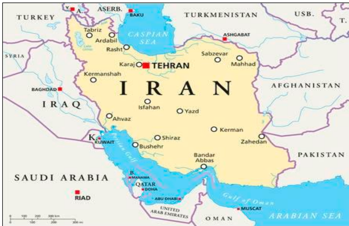
نقشه ۲: موقعیت منطقه‌ای ایران

هستند (Rahimi et al., 2019). بر اساس نتایج سرشماری سال ۱۳۷۵ درباره ترکیب قومی ملت ایران، جمعیت فارس‌ها حدود ۷۳ تا ۷۵ درصد جمعیت ایران است. آمار سرشماری سال ۱۳۷۵ نشان می‌دهد که ۸۲ تا ۸۳ درصد مردم فارسی صحبت می‌کنند و ۲/۸۶ درصد از آن‌ها فقط فارسی را می‌فهمند. ترکیب قومیتی ایران بر اساس گزارش صندوق جمعیت سازمان ملل متحد ۵۰ درصد فارسی‌زبان، ۱۹ درصد آذربایجانی، ۱۰ درصد کرد و ۶ درصد گیلک و مازندرانی، ۶ درصد لر، ۲ درصد بلوچ، ۲ درصد عرب، ۲ درصد ترکمن و ۱ نیز از دیگر اقوام است. ترکیب قومیتی ایران بر اساس داده‌های «کتاب واقعیت‌های جهان سیا» ۶۱ درصد فارسی‌زبان، ۱۶ درصد آذربایجانی، ۱۰ درصد کرد، ۶ درصد لر، ۲ درصد بلوچ، ۲ درصد عرب، ۲ درصد ترکمن و ۱ درصد از دیگر اقوام است. تهران، مشهد، اصفهان، کرج، تبریز، شیراز، اهواز، قم، کرمانشاه و ارومیه به ترتیب ۱۰ کلان‌شهر پرجمعیت ایران هستند (Rahimi et al., 2019). شهر تهران با داشتن ۱۵ میلیون، پرجمعیت‌ترین شهر ایران زمین می‌باشد و شهر مشهد با سه میلیون و صد هزار نفر دومین شهر پرجمعیت و شهر اصفهان با دو میلیون جمعیت سومین شهر پرجمعیت کشورمان به شمار می‌آیند. که مرکز استان اصفهان بوده و اهمیت گردشگری بالایی برای این کشور دارد. کرج با داشتن ۲ میلیون نفر جمعیت در رده چهارم شهرهای پرجمعیت ایران قرار گرفته است. تبریز که از نظر جمعیت پنجمین شهر کشور ایران می‌باشد محل اسکان ۱ میلیون و ۸۰۰ هزار نفر می‌باشد. پس از این شهرها بزرگ‌ترین شهرهای ایران از قرار: شیراز، قم، اهواز، ارومیه، کرمانشاه می‌باشد (Mahmoudi Balaghshefesh et al., 2019).