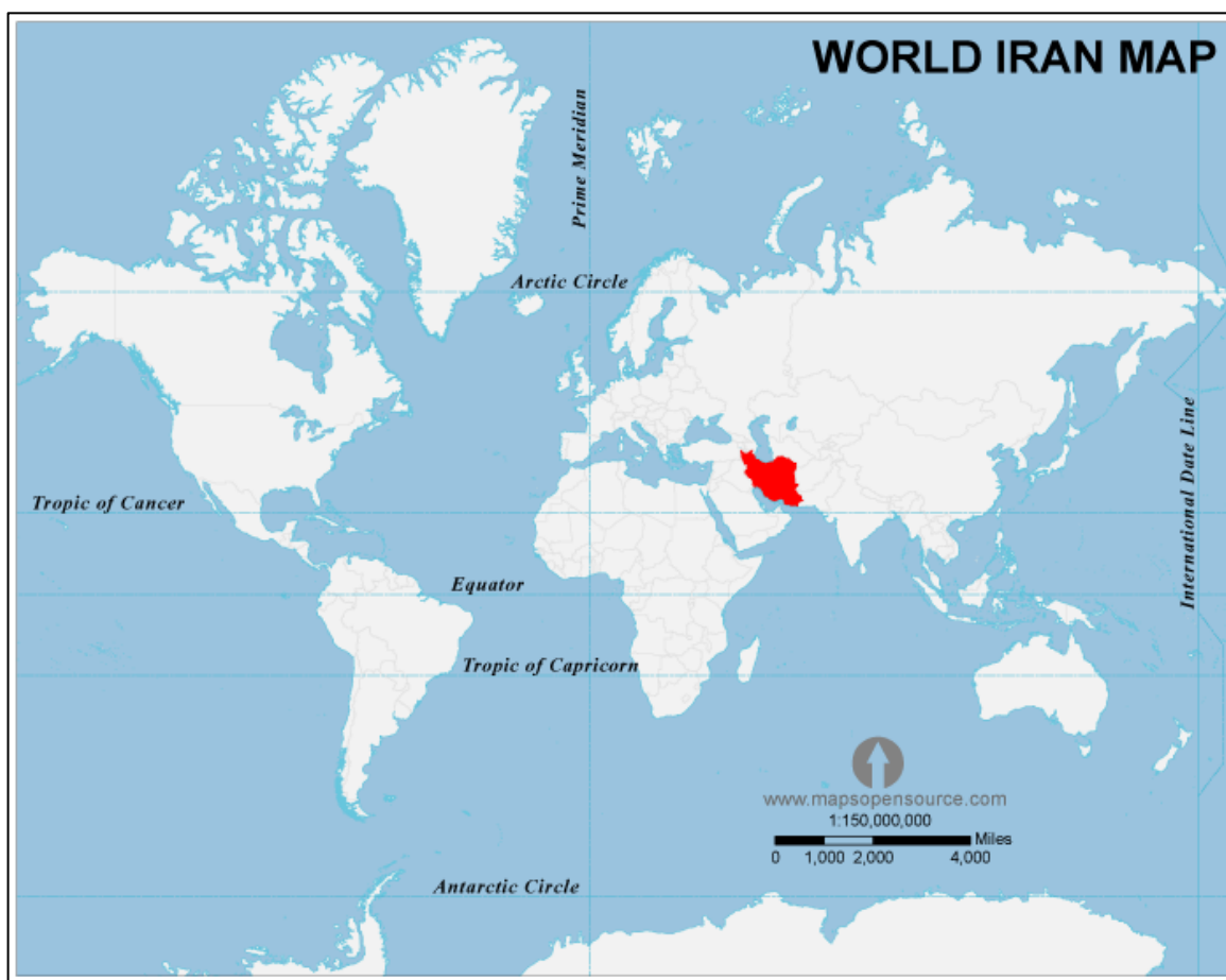
نقشه ۱: موقعیت ایران در جغرافیای جهان