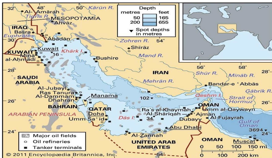
نقشه ۱: موقعیت جهانی و منطقه‌ای خلیج فارس

خلیج فارس (به زبان فارسی و به عربی الخلیج الفارسی) در ۲۴ تا ۳۰ درجه و ۳۰ دقیقه عرض شمالی و ۴۸ تا ۵۶ درجه و ۲۵ دقیقه طول شرقی از نصف النهار گرینویچ قرار دارد (Afshar Sistani, 2007).