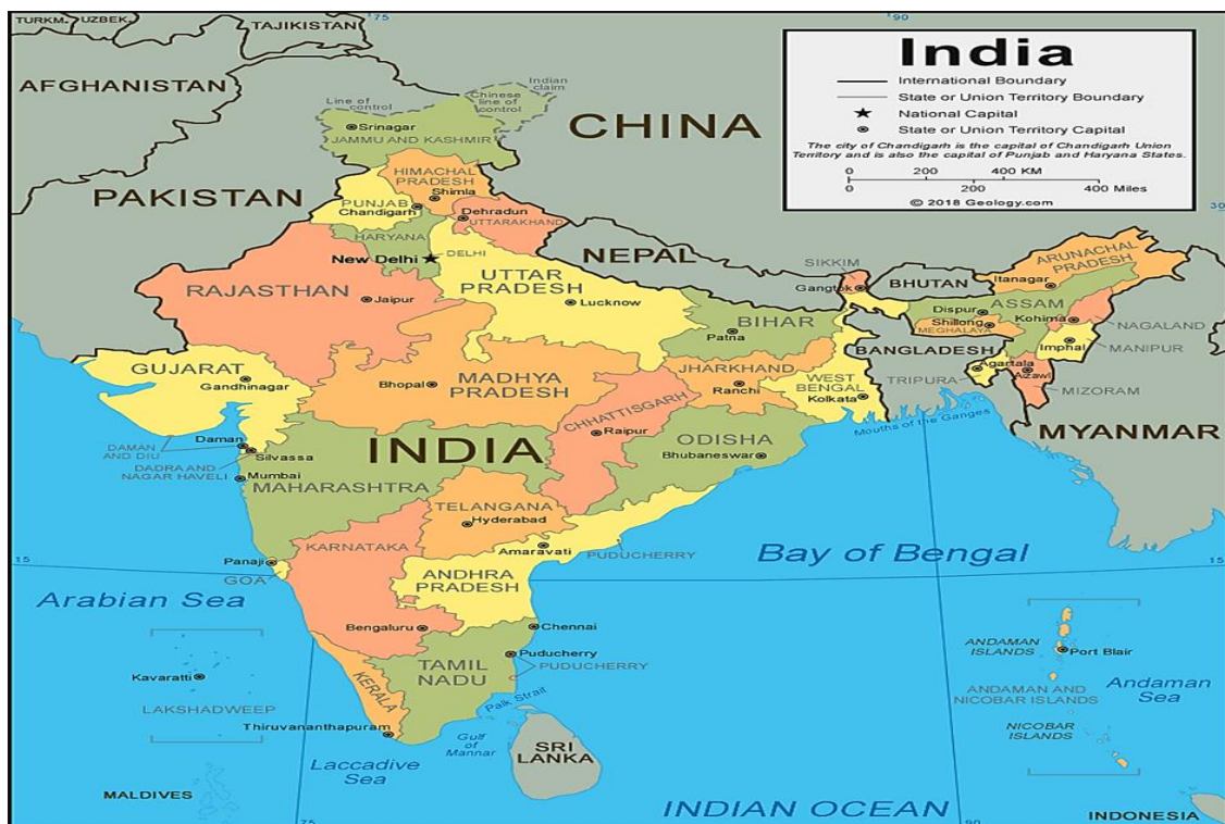
نقشه ۲: موقعیت ملی حیدرآباد

حیدرآباد با هنر و صنایع دست مختلف مشهور شده است و زیباترین هنر باستانی این شهر هنر قلمکاری یک نوع پارچه پنبه‌ای که با دست روی آن نقاشی شده است و عمدتاً در بخش‌های از ایالت آندراپرادش و تلانگانا تولید می‌شود. حیدرآباد قطب مرکزی خرید پارچه‌های سنتی کار دست است. حیدرآباد یک شهری است که بالاترین سطح دسترسی با سایر شهرهای بزرگ در هندوستان و کشورهای را دارد. شهر حیدرآباد دارای فرودگاه بین‌المللی راجیوگانندی، واقع در شمس آباد است و محل آن ۲۲ km به جنوب غربی شهر می‌باشد. حیدرآباد با دیگر کلان شهرها مانند بنگلور، چنای، کلکته، بمبئی و دهلی ارتباط ریلی و هوایی دارد. شهر حیدرآباد در جنوب هند واقع شده است و با همه شهرهای بزرگ به وسیله اتوبوس و قطار در ارتباط است. در مطالعه حاضر، منطقه به مساحت ۱۴۴۵ Km به عنوان یک منطقه مطالعاتی همراه با جاده کمربندی حیدرآباد در نظر گرفته شده است. تعداد کمی از امکان گردشگری خارج از جاده کمربندی با اتصال جاده خوب بودند. لیست دقیق مکان‌ها و نقشه منطقه مطالعه در شکل نشان داده شده است.