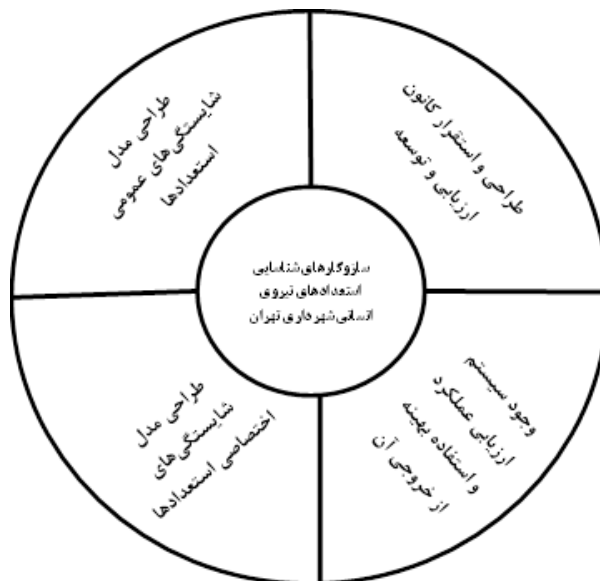
شکل ۲- مدل مفهومی سازوکارهای شناسایی استعدادهای نیروی انسانی در شهرداری تهران