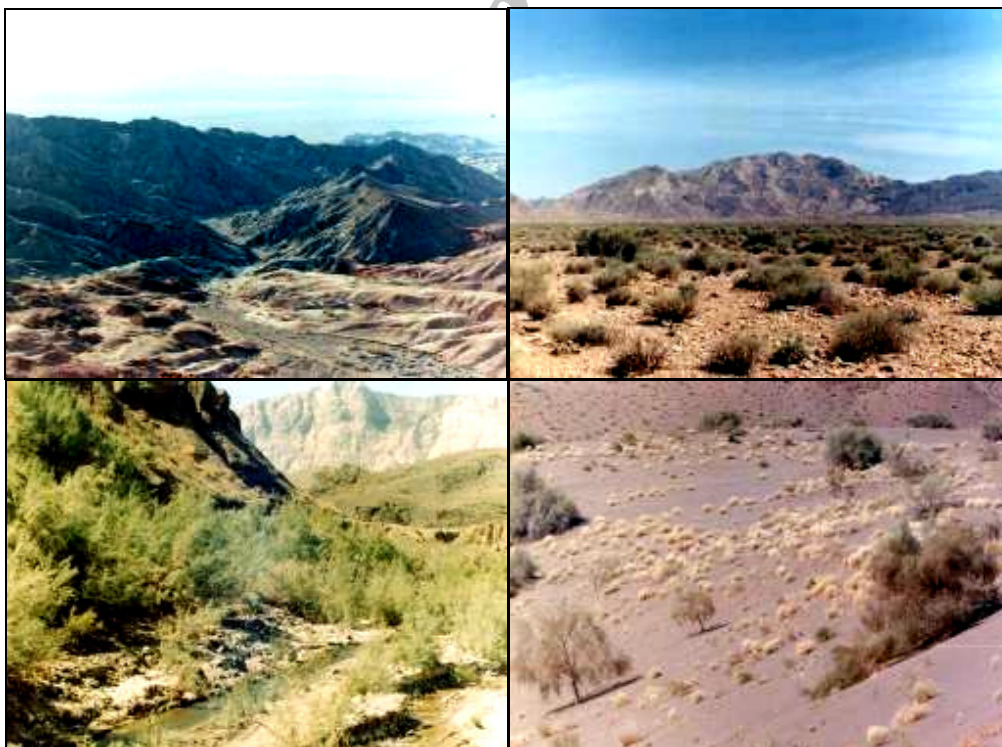
شکل ۱- نمایه‌ای از زیستگاه‌های متنوع منطقه عباس‌آباد

صورت درهم و به هم تنیده رشد می‌نمایند، از رشد ارتفاعی خوبی برخوردار بوده و لذا به نظر می‌رسد علی‌رغم حضور دام اهلی در منطقه، به علت وسعت بالای منطقه و تراکم پایین دام، فشار چندانی بر مراتع منطقه وارد نمی‌آید. گرامینه‌ها به خصوص در فصل بهار منبع غذایی مناسبی برای انواع سمداران بوده و به علت دارا بودن آب بالا، حتی بخش قابل توجهی از نیاز آبی آنها را نیز تأمین می‌نماید. شکل یک زیستگاه‌های متنوع منطقه عباس‌آباد را نشان می‌دهد. در ابتدای این مطالعه تلاش گسترده‌ای برای بدست آوردن داده‌هایی درباره گونه‌های مختلف موجود در منطقه (عمدتاً پستانداران بزرگ‌جثه) با استفاده از مصاحبه، مشاهده مستقیم و نمایه‌های بجا مانده و استفاده از دوربین‌های تله‌ای صورت گرفت. از آنجا که هر چهار گونه گوشتخوار بزرگ جثه گرگ، کفتار، یوز و پلنگ در این منطقه زیست می‌نمایند، لذا تصاویری از ردپای این جانوران در اختیار آنها قرار