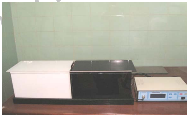
تصویر ۱: نمای کلی از دستگاه شاتل باکس

در این تحقیق از ۴۰ سر موش صحرایی نر نژاد ویستار در محدوده وزنی معین (۱۸۰ تا ۲۳۰ گرم) استفاده شد، و به مدت یک هفته جهت سازش با شرایط محیط در حیوانخانه در شرایط حرارتی 21 \pm 2 درجه سانتی گراد و ۱۲ ساعت روشنایی و ۱۲ ساعت تاریکی نگهداری شدند. در این زمان حیوانات از غذای موش صحرایی آماده ( plat ) و آب لوله کشی استفاده گردید. آزمایش در یک ساعت معین انجام می گرفت. مراحل سازش، آموزش و به یادآوری اجرا می شد و پاسخ شرطی احترازی غیرفعال در رت بررسی و ثبت می گردید. روش سنجش حافظه در این تحقیق