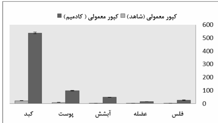
شکل ۳- مقایسه میزان تجمع کادمیم ( \mu\text{g/g.dw} ) در ماهی شاهد کپور معمولی و ماهی کپور در تیمار تحت کشنده کادمیم (روز ۱۵)