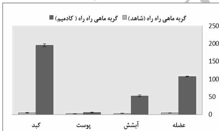
شکل ۴- مقایسه میزان تجمع کادمیم ( \mu\text{g/g.dw} ) در گربه ماهی شاهد و گربه ماهی در تیمار تحت کشنده کادمیم (روز ۱۵)