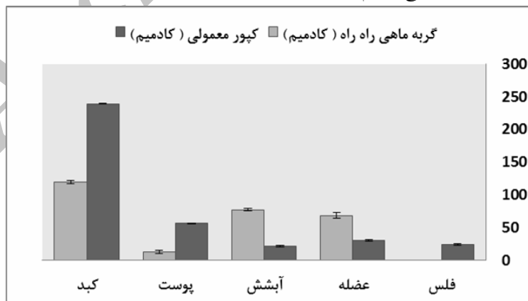
شکل ۲- مقایسه میزان تجمع کادمیم ( \mu\text{g/g.dw} ) در ماهی کپور معمولی و گربه‌ماهی راه‌راه (روز ۷)