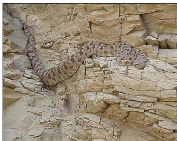
شکل ۸- Pseudocerastes Persicus