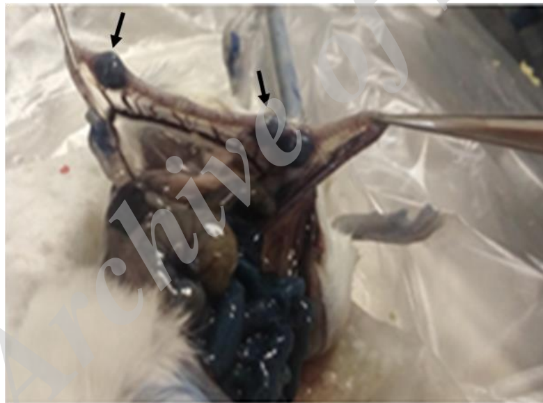
شکل ۱- رنگ‌آمیزی با ایوانس بلو. نقاط برجسته مشخص شده با فلش، رویان‌های لانه‌گزینی شده را نشان می‌دهند.

اثر میزان اکسیژن محیط کشت بر کیفیت بلاستوسیست‌ها با استفاده از روش رنگ‌آمیزی افتراقی: در بررسی اثر میزان اکسیژن محیط کشت بر کیفیت بلاستوسیست، در مجموع ۷۷ بلاستوسیست، حاصل از کشت رویان‌های دوسلولی در شرایط ذکر