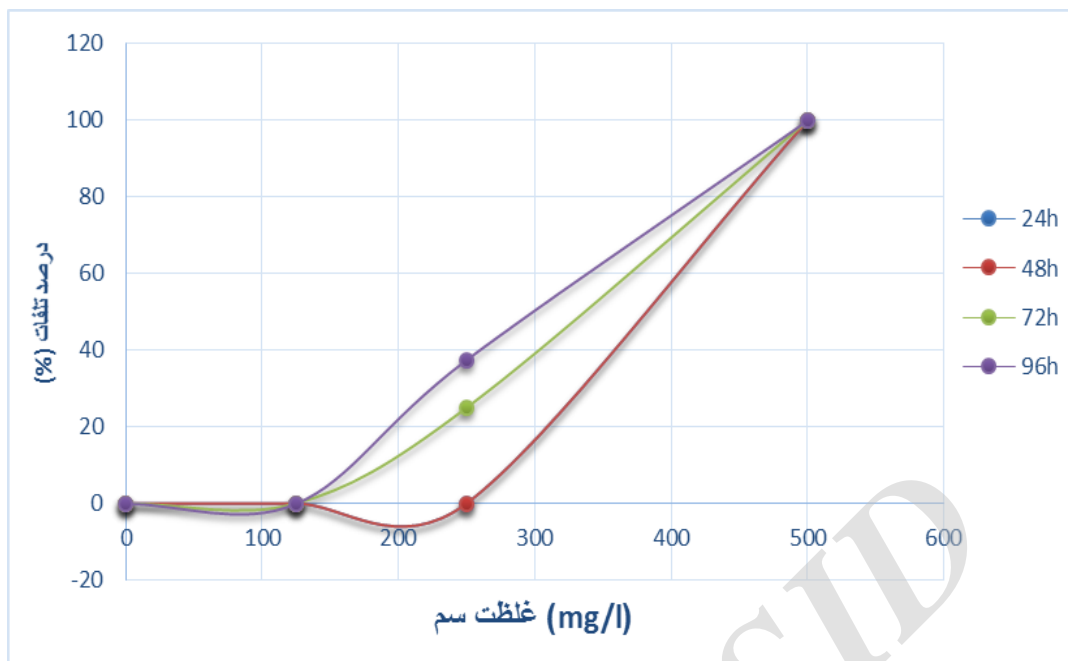
شکل ۲- نمودار روند تغییرات تلفات ماهیان مورد بررسی در غلظت‌های گوناگون سم کنفیدور