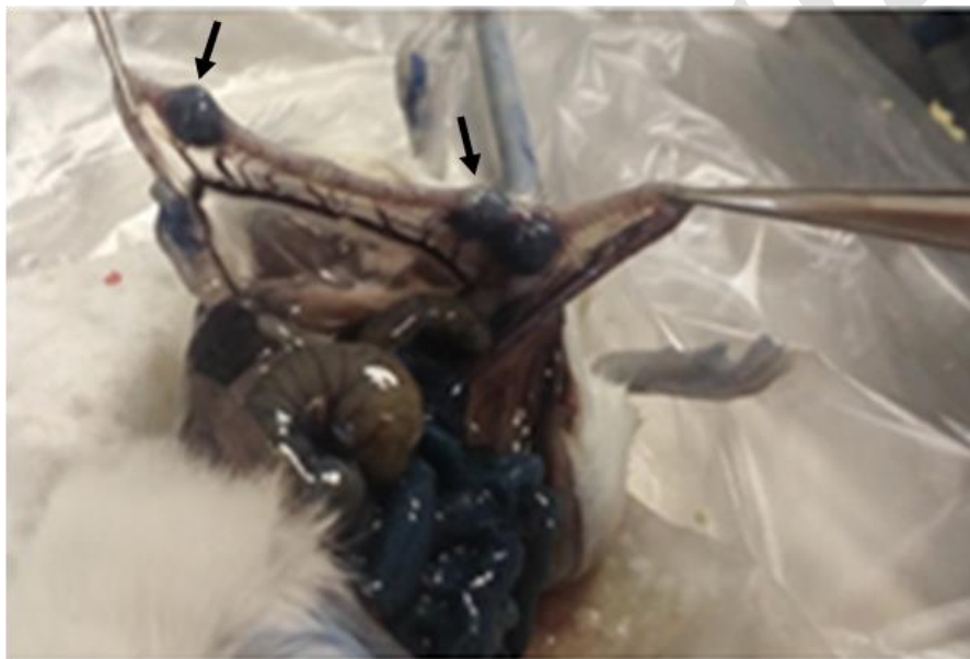
شکل ۱- رنگ‌آمیزی با ایوانس بلو. نقاط برجسته مشخص شده با فلش، رویان‌های لانه‌گزینی شده را نشان می‌دهند.