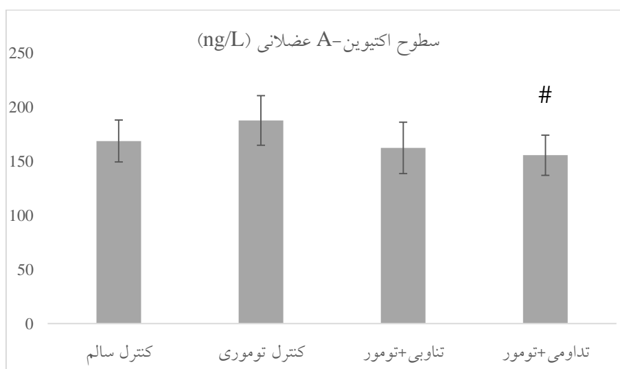
نمودار ۲- تغییرات سطوح اکتیوین-A در عضله دوقلو. # نشانه تفاوت معنادار با گروه کنترل توموری