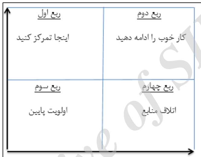
شکل (۲)- تحلیل عملکرد-اهمیت ماتریس دوبعدی

ربع اول (اینجا تمرکز کنید). مشخصه‌های ادراک‌شده برای پاسخ‌دهندگان بسیار مهم هستند، اما سطح عملکرد به نسبت پایین است. این ربع ضعف اساسی سازمان را نشان می‌دهد، بنابراین نیازمند توجه فوری برای بهبود است. نکته اساسی این است که ناتوانی برای شناسایی مشخصه‌ها در این ربع، موجب رضایت پایین مشتری می‌شود. در حقیقت تلاش برای بهبود باید در بالاترین اولویت قرار گیرد؛ زیرا ضعف اساسی در این ناحیه است.