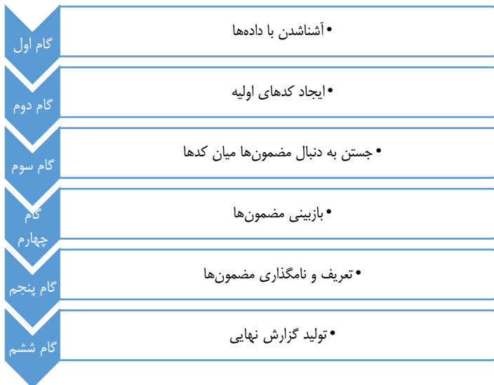
شکل ۴. فرایند تحلیل مضمون از منظر براون و کلارک

برای انجام پژوهشی با روش تحلیل مضمونی سه مرحله اساسی را باید پشت سر گذاشت؛ نخست، تجزیه و تعمیق در متن، سپس بررسی متن و کدگذاری و در مرحله نهایی بازسازی و تولید گزارش نهایی. برخی مثل براون و کلارک فرایند تحلیل مضمون را در شش مرحله توضیح داده‌اند: