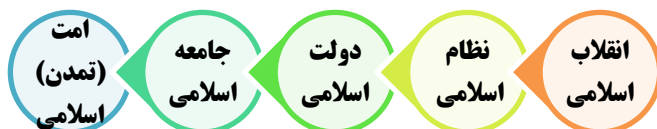
شکل ۱. مراحل ساخت تمدن اسلامی از دیدگاه مقام معظم رهبری

رهبر معظم انقلاب معتقدند که ما در مرحله سوم یعنی تشکیل دولت اسلامی و ساخت کشوری اسلامی هستیم، در همین رابطه ایشان می‌فرمایند: «ما در مرحله سومیم؛ ما هنوز به کشور اسلامی نرسیده‌ایم. هیچ‌کس نمی‌تواند ادعا کند که کشور ما اسلامی است. ما یک نظام اسلامی را طراحی و پایه‌ریزی کردیم و الان یک نظام اسلامی داریم که اصولش هم مشخص و مبنای حکومت در آنجا معلوم است. مشخص است که مسئولان چگونه باید باشند. قوای سه‌گانه وظایفشان معین است. وظایفی که دولت‌ها دارند، مشخص و معلوم است؛ اما نمی‌توانیم ادعا کنیم که ما یک دولت اسلامی هستیم؛ ما کم داریم. ما باید خودمان را بسازیم و پیش ببریم» (بیانات در دیدار کارگزاران نظام، ۱۳۷۹/۰۹/۱۲). اکنون مرحله تشکیل دولت اسلامی است و یکی از نقاط مهم و مؤثر شکل‌دادن به یک دولت اسلامی، داشتن کارآمدی لازم برای دولت بوده که سبب مشروعیت ثانویه کافی برای حکومت نیز می‌شود. این کارآمدی باید به‌صورت بومی‌شده در جهت رسیدن به اهداف کشور و سعادت ملت عمل نماید. اطلاع از سیاست‌ها و راهبردهای لازم جهت ارتقای کارآمدی نظام اسلامی به جامعه نخبگانی و مردم کمک می‌کند مطالبات دقیق‌تری داشته باشند و رسیدن به شایسته‌سالاری در انتخاب مدیران نیز به تحقق نزدیک شود.