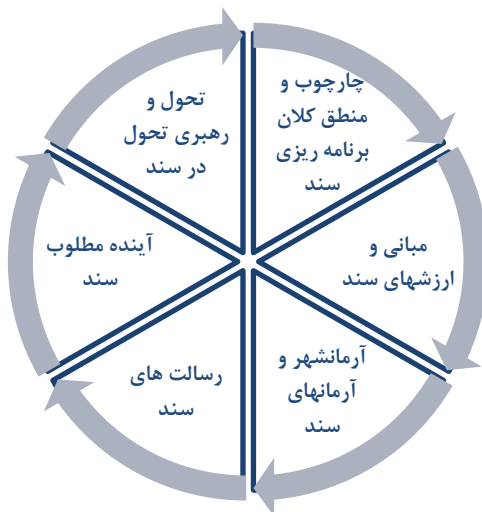
شکل ۳. مدل ساختاری الگوی اسلامی- ایرانی پیشرفت (عیوضی، ۱۳۹۵)

از بعد برنامه‌ریزی، الگوی پیشرفت تجلی خاصی از «برنامه‌ریزی بلندمدت» است که جریان آگاهانه انتخاب و تعیین اولویت‌ها به منظور تصمیم‌گیری آینده‌نگرانه را ترسیم و تبیین می‌نماید. در همین زمینه، یعنی برنامه‌ریزی راهبردی، مفهوم «آینده‌نگری» نیز قابل توجه است. به عبارت دیگر، در فضای تفکر راهبردی، مفهوم مرتبط با تصویرسازی، چشم‌اندازسازی و رویکردهای توصیفی راهبردی دارای اهمیت فراوانی است. براین‌منا، هرچند برنامه‌ریزی راهبردی به عنوان اجراکننده تفکرات راهبردی و در راستای به مرحله عمل رساندن راهبردهای حاصل از تفکر راهبردی می‌تواند نقشی حیاتی ایفا کند، آینده‌نگاری نیز به دلیل برخورداری ذاتی از تناسب لازم با ویژگی‌های تفکر راهبردی، در حجم گسترده‌ای به رفع نیازهای این سنخ تفکر قادر خواهد بود (کرامت‌زاده، ۱۳۸۷: ۱۳۵).