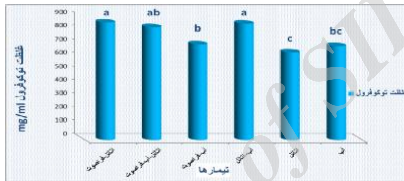
شکل 2- اثر نوع حلال و فراصوت بر میزان توکوفرول عصاره فلفل قرمز ایرانی حروف متفاوت نشانگر وجود اختلاف معنی دار بین تیمارها می باشد ( P < 0.05 ).