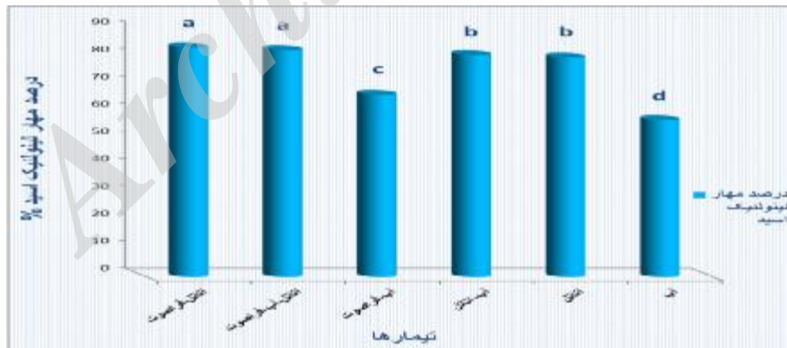
شکل 3- اثر نوع حلال و فراصوت بر میزان خاصیت آنتی اکسیدانی عصاره فلفل قرمز ایرانی حروف متفاوت نشانگر وجود اختلاف معنی دار بین تیمارها می باشد ( P < 0.05 ).