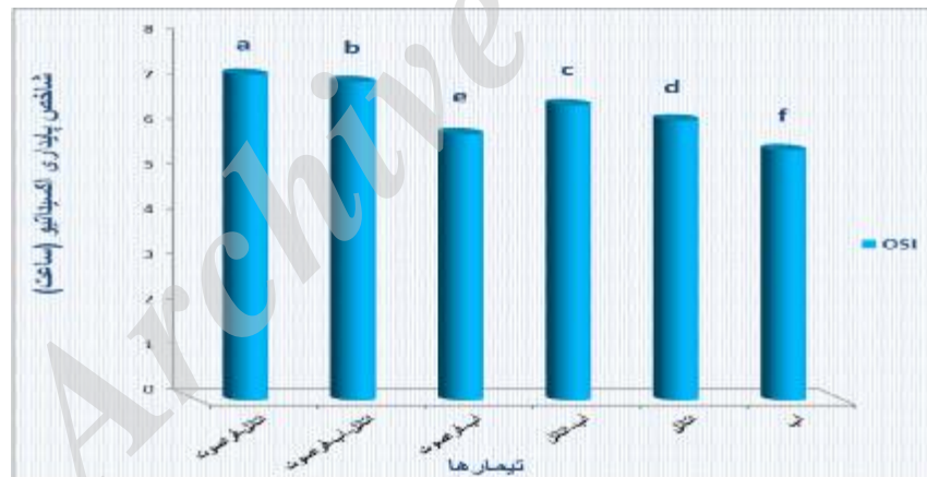
شکل 5- اثر نوع حلال و فراصوت بر شاخص پایداری اکسیداسیونی عصاره فلفل قرمز ایرانی حروف متفاوت نشانگر وجود اختلاف معنی دار بین تیمارها می باشد (P<0.05).