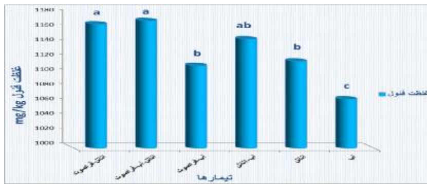
شکل 1- اثر نوع حلال و فراصوت بر میزان ترکیبات فنولی عصاره فلفل قرمز ایرانی متفاوت نشانگر وجود اختلاف معنی دار بین تیمارها می باشد ( P < 0.05 ).