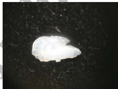
شاخص اندازه اتولیت: ۰/۰۲۵ شاخص کشیدگی: ۱/۸ شاخص ضخامت: ۰/۲۷

مشخصات ریخت‌شناسی اتولیت ساردین رنگین‌کمان Dussumeria acuta اندازه اتولیت کوچک با ضخامت متوسط می‌باشد. اتولیت در سطح پروکسیمال دارای تحدب ناچیز و در سطح دیستال مسطح است. روستروم کشیده و نسبتاً تیز،