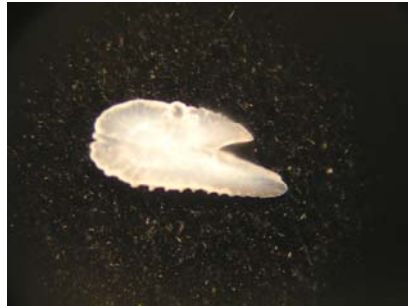
شاخص اندازه اتولیت: ۰/۰۲۱ شاخص کشیدگی: ۲/۲ شاخص ضخامت: ۰/۱۹