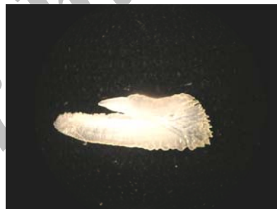
شکل ۷- تصویر اتولیت سمت راست قباد

مشخصات ریخت‌شناسی اتولیت ماهی قباد Scomberomorus guttatus این ماهی دارای اتولیت‌های بسیار کوچک، ظریف و نازک است. در سطح پروکسیمال دارای تحدب ناچیز و در سطح دیستال اندکی مقعر است. روستروم تیز و کشیده، آنتی‌روستروم تیز و برآمده و پست‌روستروم مشخص و نسبتاً کند است (تیز نیست). فاصله روستروم