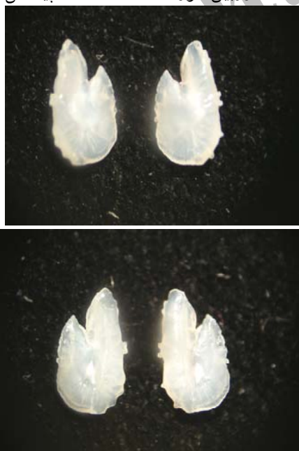
شکل ۱- مقایسه سطح پروکسیمال (خاوی شیار سولکوس) و دیستال در اتولیت: سمت چپ سطح پروکسیمال، سمت راست سطح دیستال

به ترتیب ۸، ۵، ۴، ۳۰، ۱۱، ۱۰ و ابزار صید ماهیان در این بررسی، تور پیاله‌ای و گوشگیر سطح بود. مشخصات زیست‌سنجی هر نمونه شامل وزن، طول کل، طول استاندارد و طول چنگالی اندازه‌گیری و ثبت گردید. استخراج اتولیت‌ها از سطح شکمی ماهی و به روش میان‌آبشی انجام گرفت (۸). پس از استخراج اتولیت‌ها با اتانول ۷۰٪ تمیز شده و پس از خشک شدن در ظروف شیشه‌ای کوچک نگهداری شدند. شکل اتولیت‌ها به کمک استریومیکروسکوپ بررسی گردید. بیومتری اتولیت‌های بزرگ (با طول بزرگتر از ۵ میلی‌متر) به کمک کولیس و با دقت ۰/۱ میلی‌متر انجام شد. بیومتری اتولیت‌های کوچکتر نظیر اتولیت ساردین ماهیان و موتو ماهیان با کمک استریومیکروسکوپ و لنز چشمی مدرج با دقت ۰/۰۱ میلی‌متر انجام گردید. توزین اتولیت‌ها با استفاده از ترازوی دیجیتال با دقت ۰/۰۰۱ گرم و برای اتولیت‌های بسیار ریز با ترازوهای دیجیتالی با دقت ۰/۰۰۰۱ و ۰/۰۰۰۰۱ گرم انجام گرفت (۲). برای عکسبرداری اتولیت‌ها از استریومیکروسکوپ و دوربین دیجیتالی استفاده شد. تصاویر هم از سطح پروکسیمال و هم از سطح دیستال تهیه شدند. قدرت تفکیک دستگاه دوربین مورد استفاده، ۵ مگا پیکسل بود.