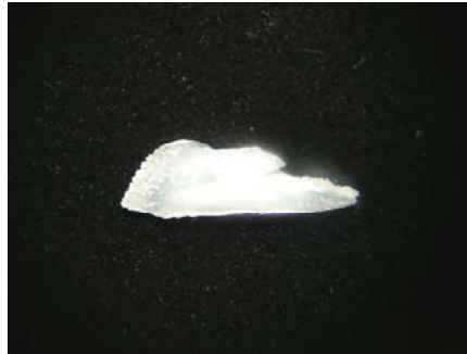
شکل ۶- تصویر اتولیت سمت چپ شیر ماهی