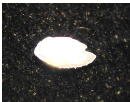
شکل ۵- تصویر اتولیت سمت چپ موتو منقوط

اتولیت کوچک اما نسبتاً ضخیم است. اتولیت در سطح پروکسیمال دارای تحدب ناچیز و در سطح