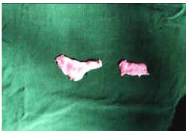
شکل شماره ۱ - افزایش ابعاد (طول، عرض و حجم) و وزن غده در گروه آزمایش (سمت چپ) در مقایسه با گروه شاهد (سمت راست)

هسته سلولهای واحدهای ترشحي گرد و بازوفیلیک بوده و کاملاً در قاعده سلول قرار داشتند. برخلاف واحدهای ترشحي غده، مجاری تحت تاثیر دارو قرار نگرفته بودند. همچنین در مقایسه غده بناگوشی سمت چپ و راست مشاهده گردید که غده بناگوشی سمت چپ بیشتر تحت تاثیر دارو قرار گرفته است و واحدهای آسینی آن بزرگتر شده اند. لازم به توضیح است که اثرات داروی ایزوپرنالین در تمام ۱۰ قلاده گربه ماده یکسان بوده و تغییرات ذکر شده در تمام ۱۰ قلاده گربه مشاهده گردید.