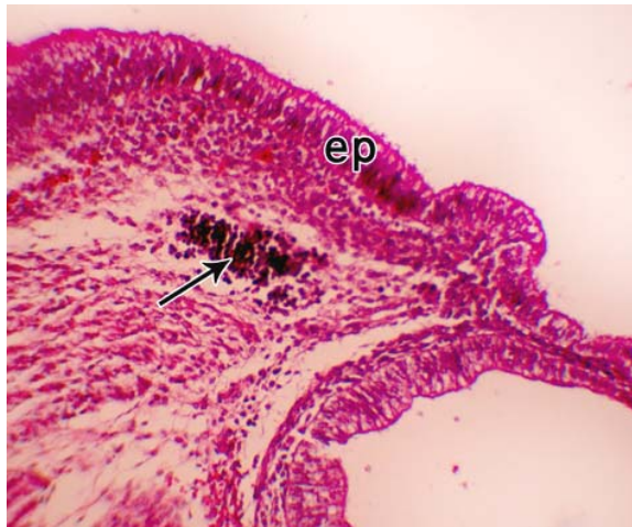
شکل شماره ۲ - جنین با C-RL=30cm ep: اپیتلیوم مخاط، پیکان: ندول لنفاوی بزرگنمایی: ۱۵۰ x