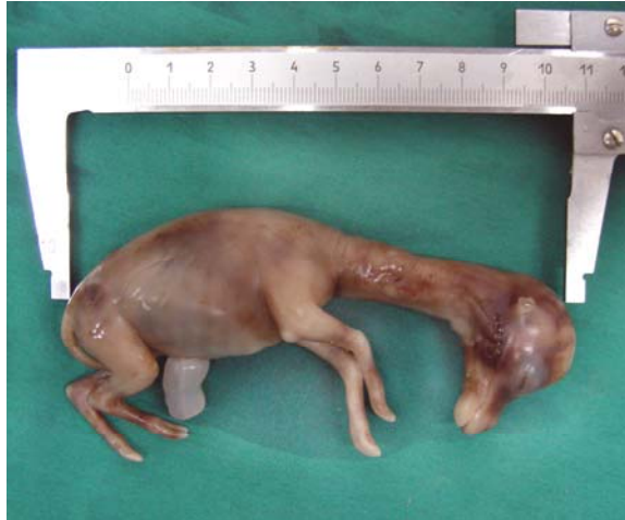
شکل شماره ۱- تعیین سن جنین بر اساس معیار C-RL