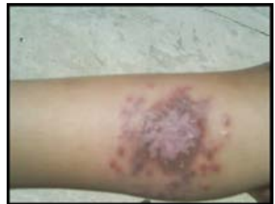
شکل ۸- چهار هفته پس از درمان با گلوکانتیم