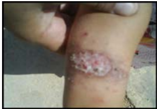
شکل ۷- اوایل درمان با گلوکانتیم