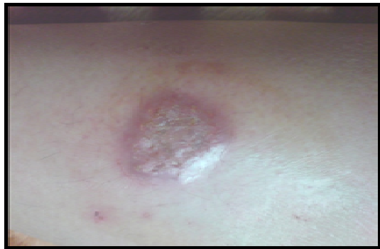
شکل ۶- (سه هفته پس از استعمال)