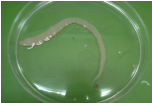
شکل ۱- پلروسکوئید جدا شده در داخل سرم فیزیولوژی (نویسنده)

هر فصل به ساحل جنوبی دریاچه سد وحدت با تور پره مناسب از نظر اندازه و سایز اقدام به صید ماهی شد که در نهایت ۱۲۰۰ عدد ماهی در طول یکسال صید گردید. تمامی نمونه ها بلافاصله بعد از صید به آزمایشگاه دانشکده دامپزشکی واحد سنندج منتقل و پس از بیومتری و شناسایی ماهیان مورد نظر با استفاده از کلیدهای معتبر ماهی شناسی، ماهیان شا کولی تیگریس از سایر ماهیان جدا شدند. در ادامه شکم ماهیان مورد نظر شکافته شده و در صورت وجود پلروسکوئید یا پلروسکوئیدها جداسازی آنها انجام شده و در داخل ظروف جداگانه شماره دار مشخص گردید (شکل ۱). ماهیان مورد نظر نیز شماره گذاری شدند تا در مرحله بعدی با شناسایی و تایید انگل به آمار افزوده شوند. جهت تایید انگل لیگولا پلروسکوئیدهای خارج شده از ماهیها بمدت ۱۲ ساعت داخل رنگ کارمن رقیق شده با آب به نسبت ۱ به ۵۰ قرار داده شده و بعد از آن داخل پتری دیش زیر استرئواسکوپ با بزرگنمایی ۴۰ بررسی و پلروسکوئیدهای لیگولا بخاطر وجود یک خط در وسط استروویلاهی آن تایید گردیدند (۳) (شکل ۲). همچنین تعداد پلروسکوئید خارج شده از محوطه بطنی هر کدام از ماهیان شمارش و ثبت شد. نتایج در نرم افزار Excel 2007 ثبت و مورد تجزیه و تحلیل قرار گرفت.