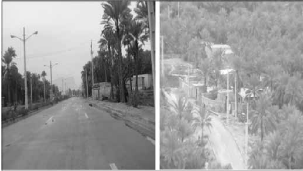
تصاویر شماره ۵ و ۶: نخلستان و باغ شهر فین

قرار گرفته و حتی گاه استخوان‌بندی محورهای اصلی شهر را شکل بخشیده‌اند.