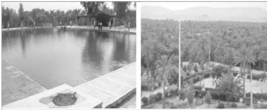
تصاویر شماره ۱ و ۲: درختان نخل و استخر فین

شهر فین با دارا بودن فضای وسیع نخلستان متراکم و خیابان‌های عموماً عاری از بدنه ساختمانی به عنوان یکی از نمونه‌های نادر و واقعی باغ-شهر در سطح کشور می‌باشد. اغلب اماکن شهر در میان نخلستان‌ها احداث شده به طوری که خیابان‌ها و دسترسی‌های شهر به مثابه شبکه‌های ارتباطی یک پارک بزرگ مورد استفاده اهالی شهر قرار دارد. برخورداری فین از شبکه جاده‌ای و ریلی و دارا بودن مجموعه‌ای از پتانسیل‌های گردشگری شامل جاذبه‌های طبیعی (آبشار، نقاط ارتفاعی، نخیلات و...) جاذبه‌های تاریخی (قلعه فین، آسیاب و...) و فضاهای انسان ساخت (مجموعه استخر، حمام‌ها و...) باعث شده تا فین از سایر نقاط متمایز گردد (تصاویر ۱، ۲). در ادامه مهم‌ترین جاذبه‌های توریستی شهر فین معرفی می‌شود.