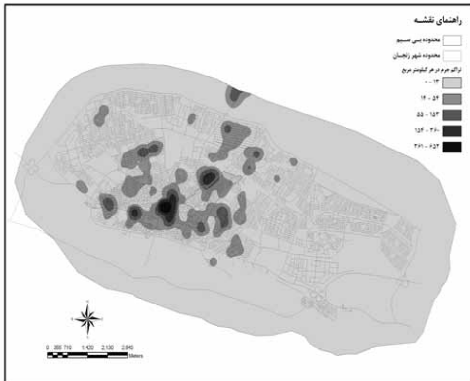
نقشه شماره ۲: کانون های جرم خیز بزه ایجاد مزاحمت خیابانی در شهر زنجان